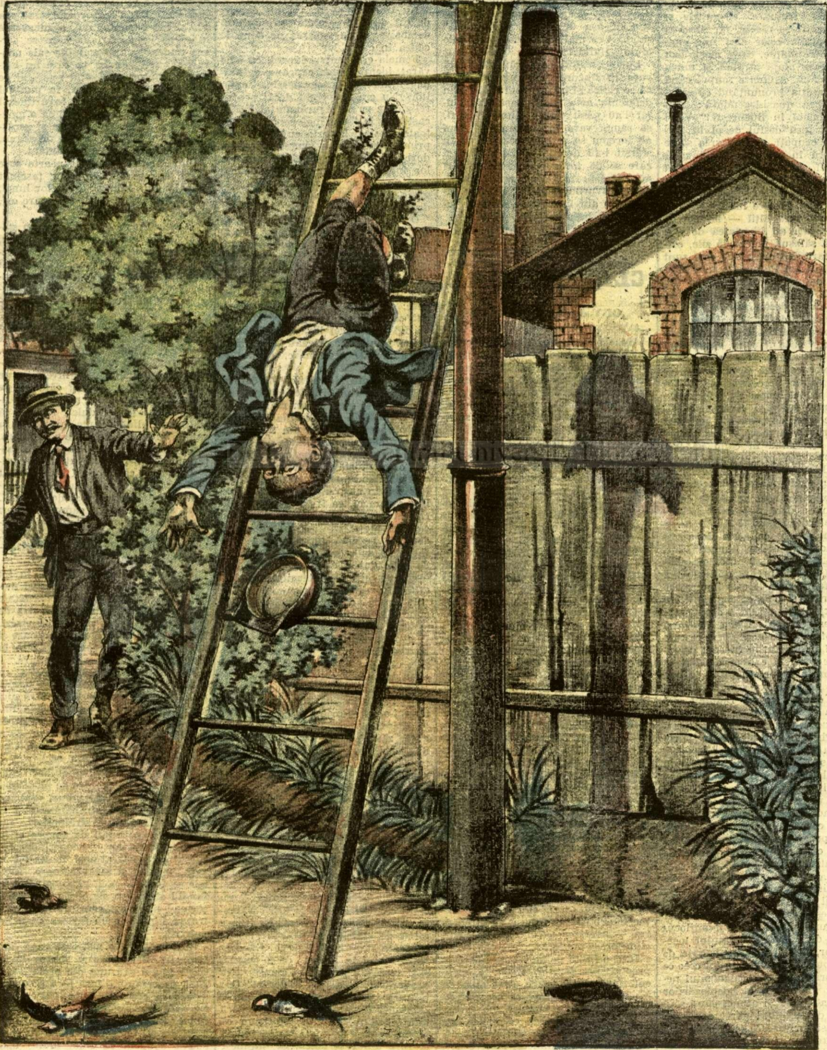
UN COPIL UCIS DE CURENTUL ELECTRIC. — (Vezi explicația).