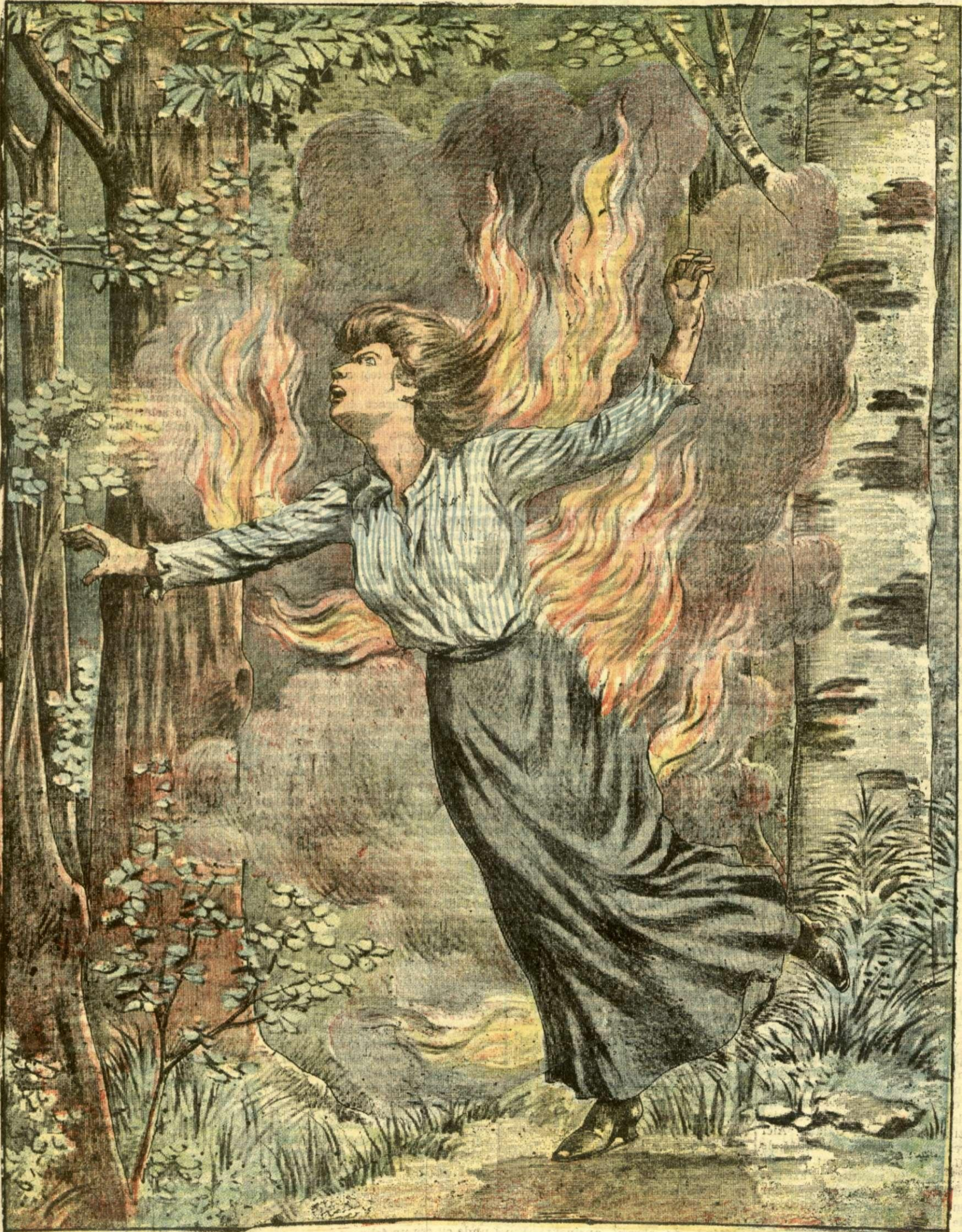
DRAMATICA SINUCIDERE A UNEI FETE LA UNGHENI. — (Vezi explicația).