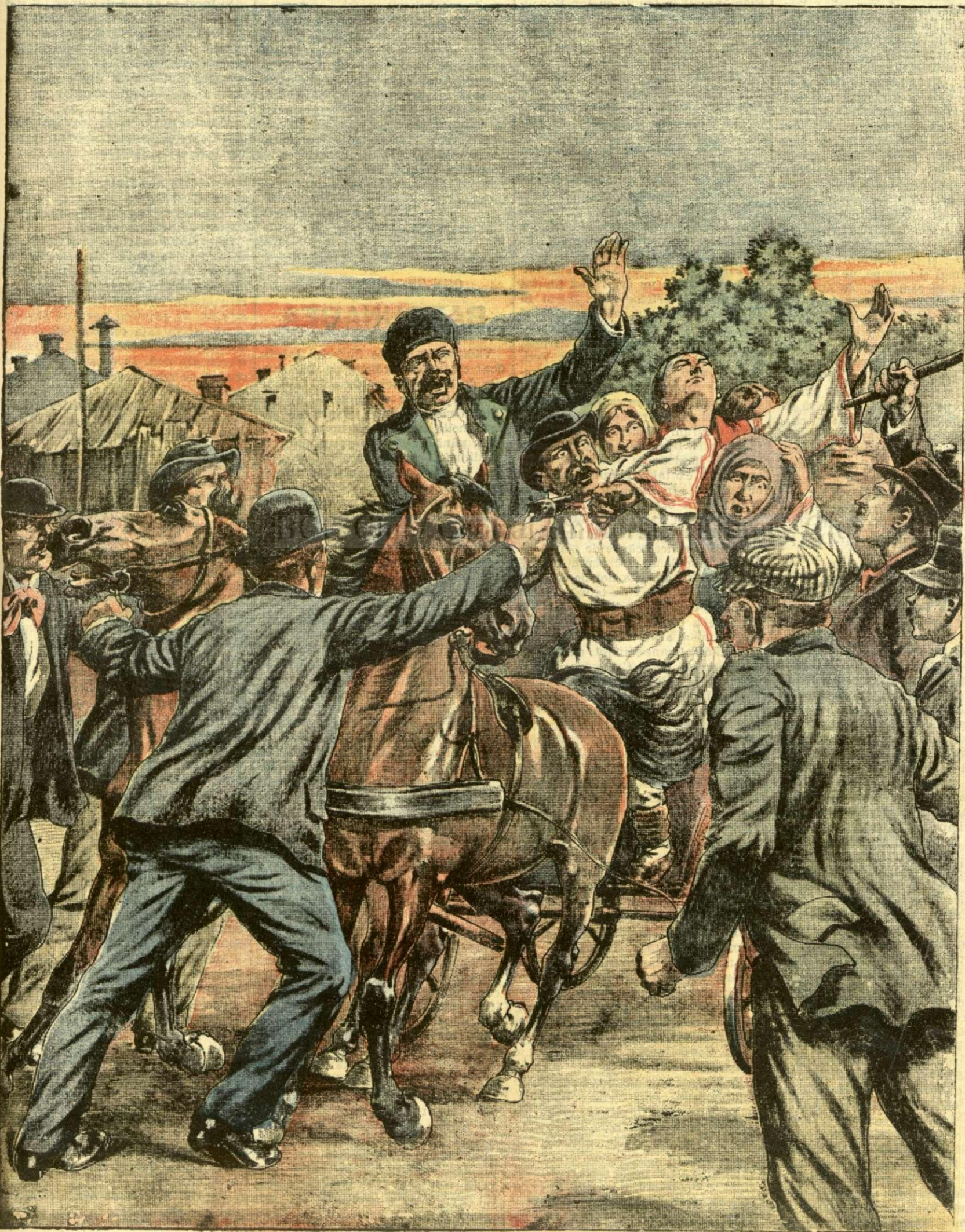
O ISPRAVĂ A APAȘILOR CAPITALEI. — (Vezi explicația).