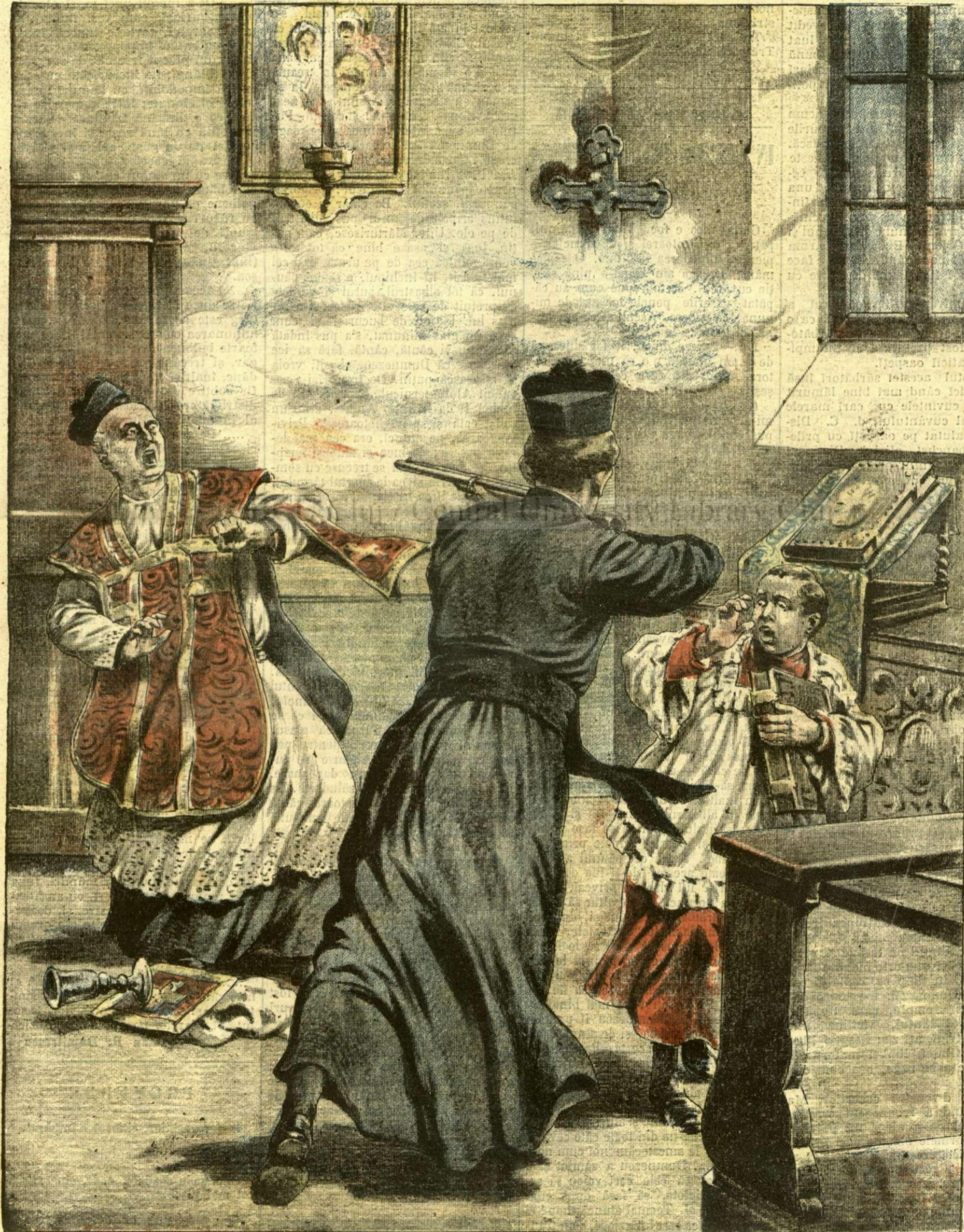
O dramă într-o biserică din Italia. — (Vezi explicația).