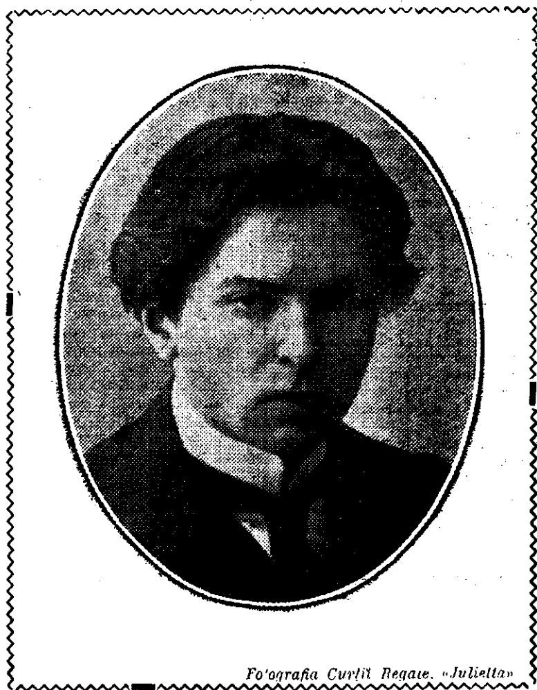
„Julietta”

D. George Enescu este unul din cele mai puternice talente muzicale pe care le-a avut țara noastră. Splendid înzestrat, cu un temperament și o ureche de o deosebită muzicalitate, cu o cultură muzicală încă necompletă, pe atunci, d. George Enescu s'a afirmat încă de acum vre-o zece ani ca muzicant de valoare, ca violonist de seamă.