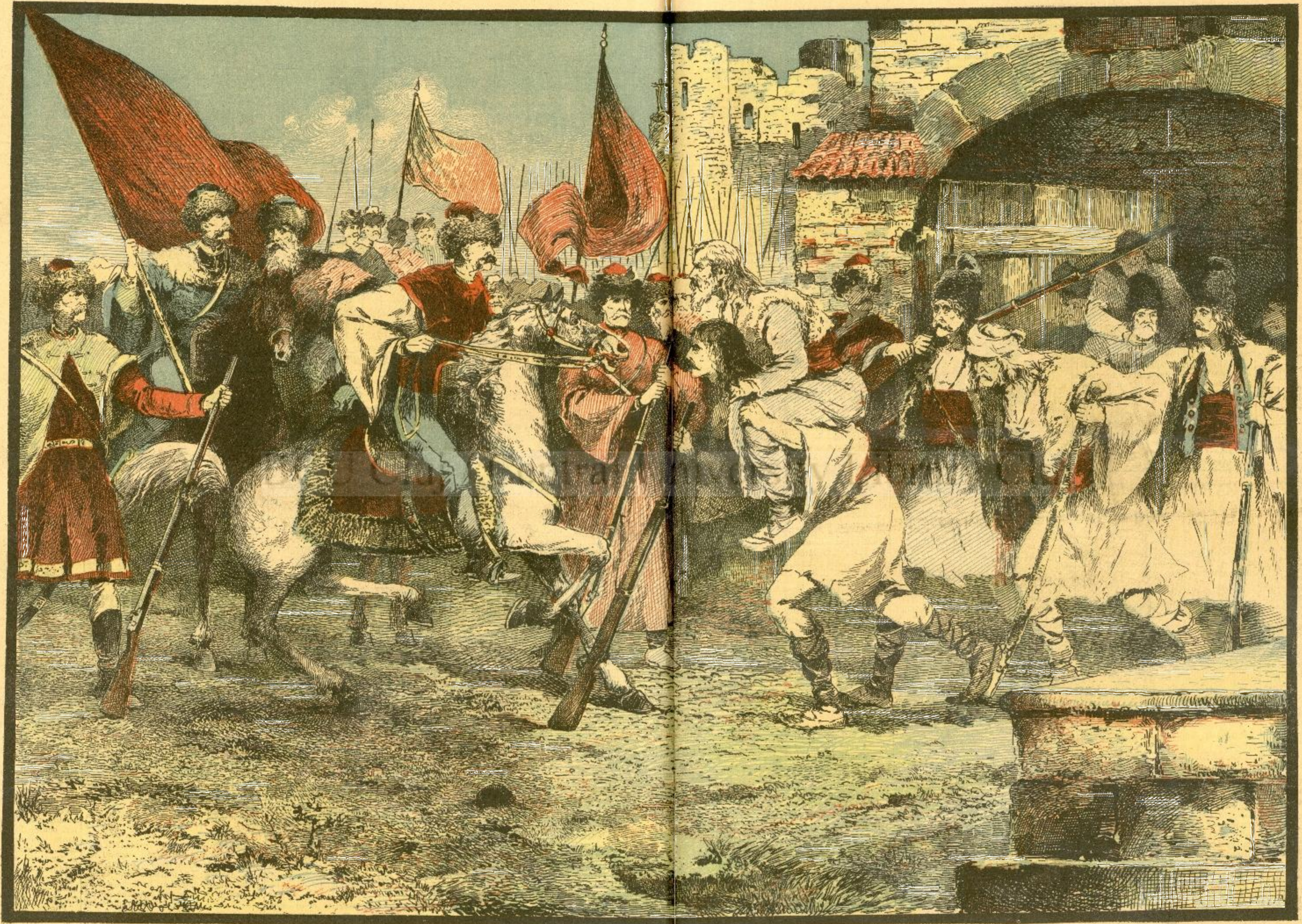
SOBIESKY ȘI PLAȘII. — (Vezi explicația)