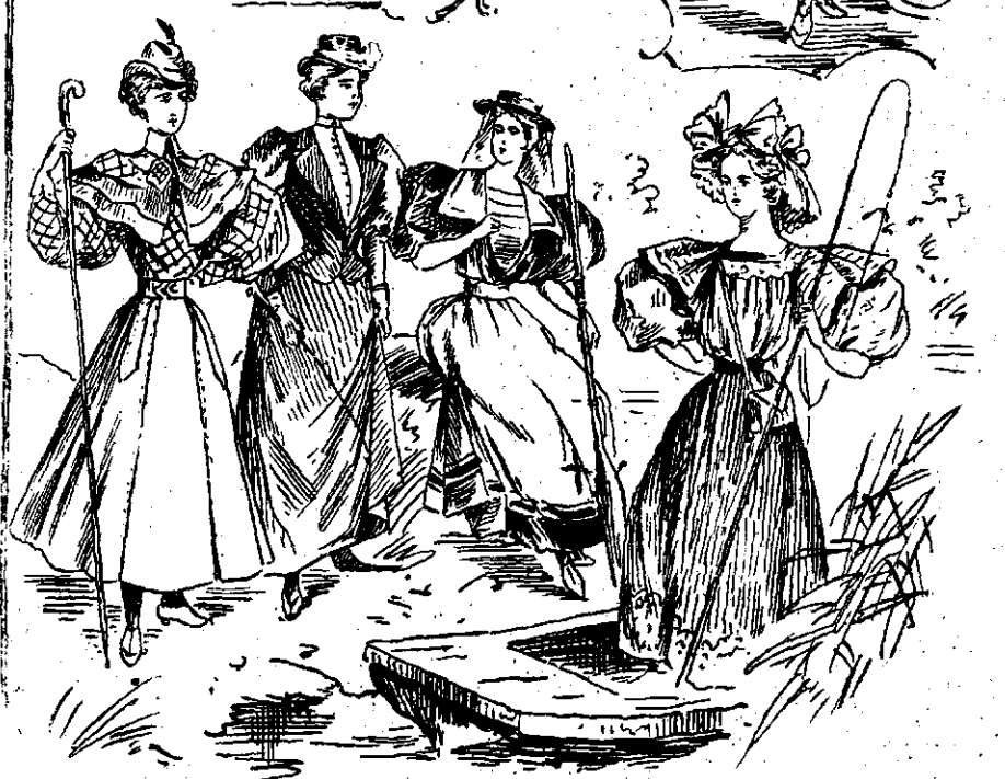
MODA. — (Vezi explicația)

Năstându-se cu simțul, cu gândul printre stele Cătdând nemărginitul în suflet mărginit.