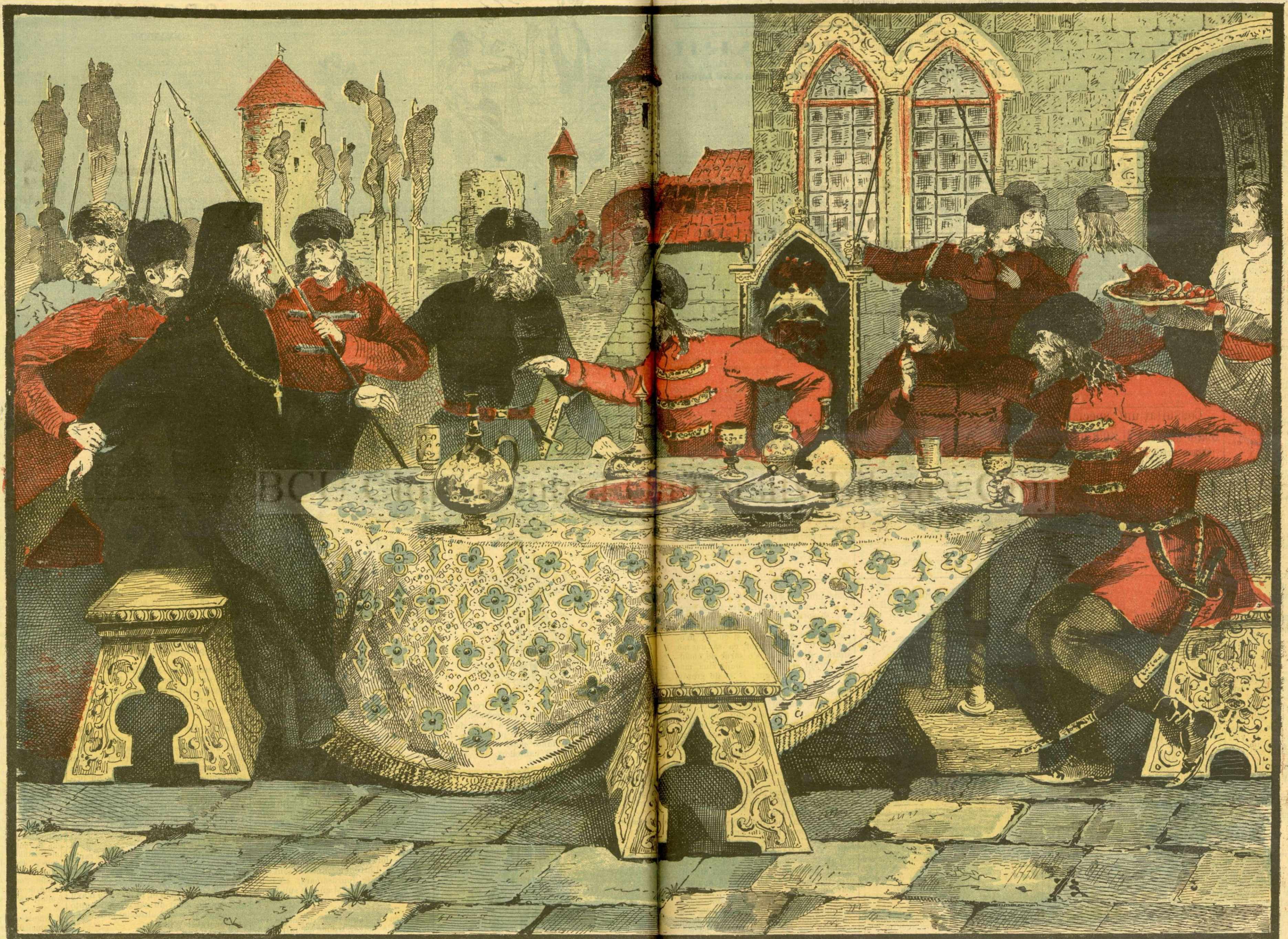
BANCHETUL LUI VLAȚEȘ. --- [Vezi explicația]