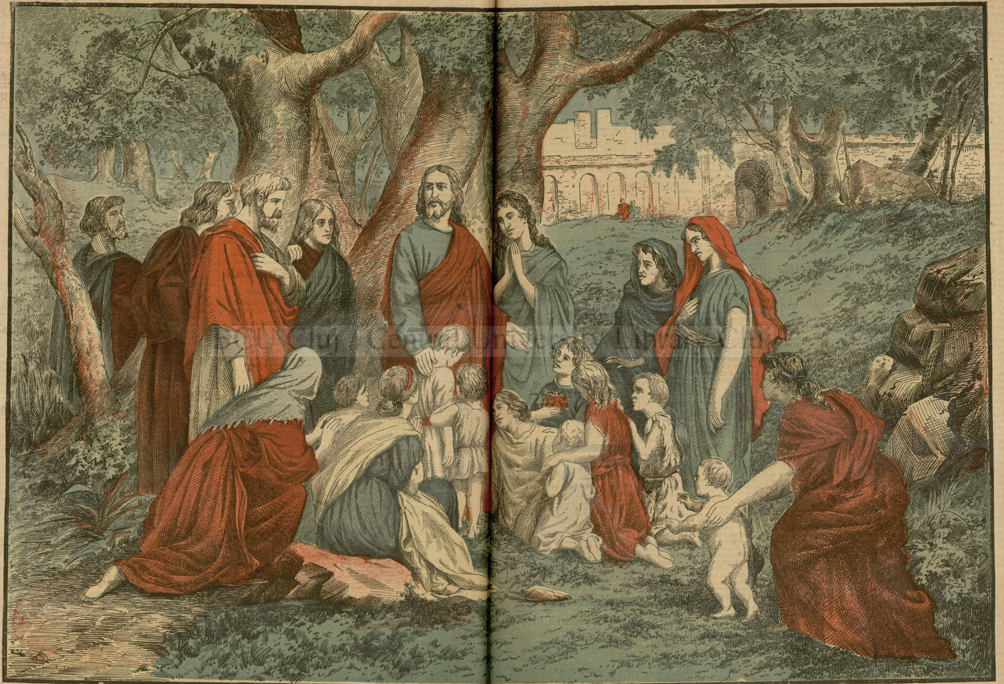
ISUS CHRISTOSI COPIL. — (Vezi explicația).