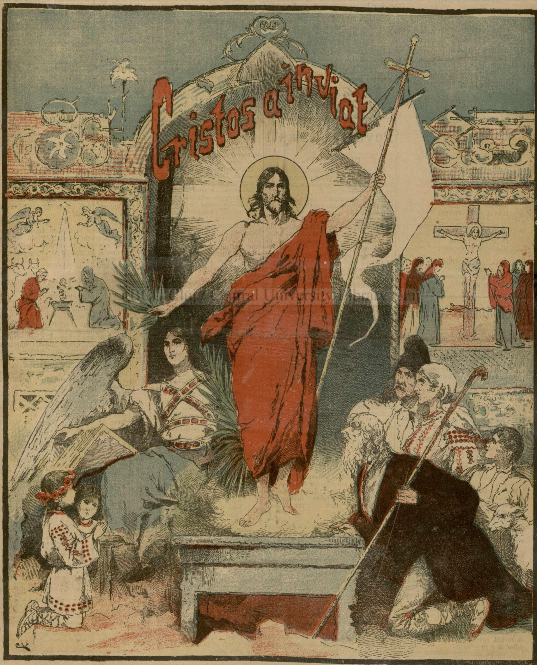
CHRISTOS A INVIAT. — (Vezi explicația).