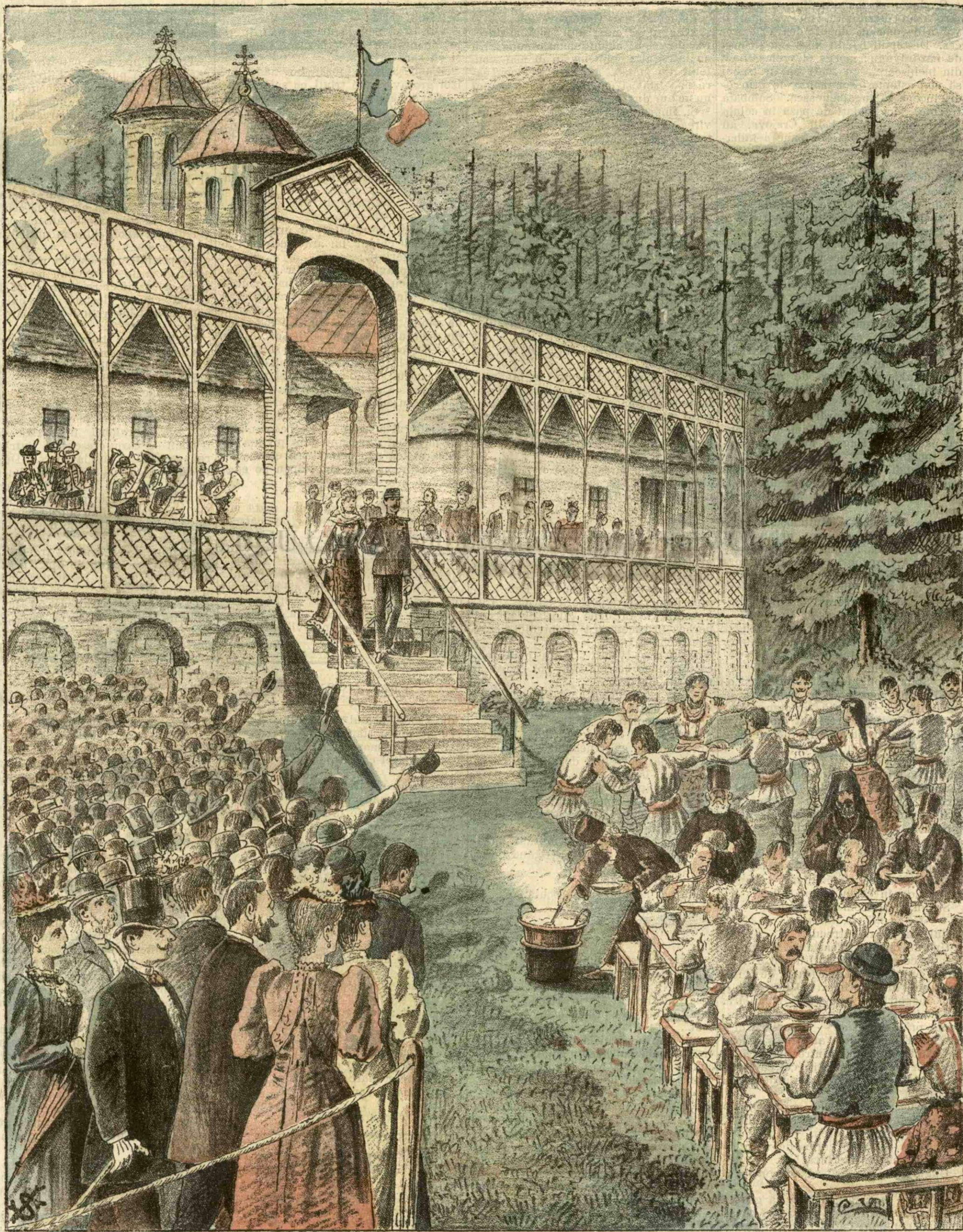
SERBAREA SF. MARIA LA SINAIA. — (Vezi explicația).