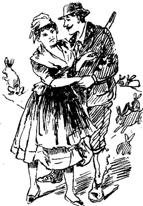
Deschiderea sezonului de vânătoare.