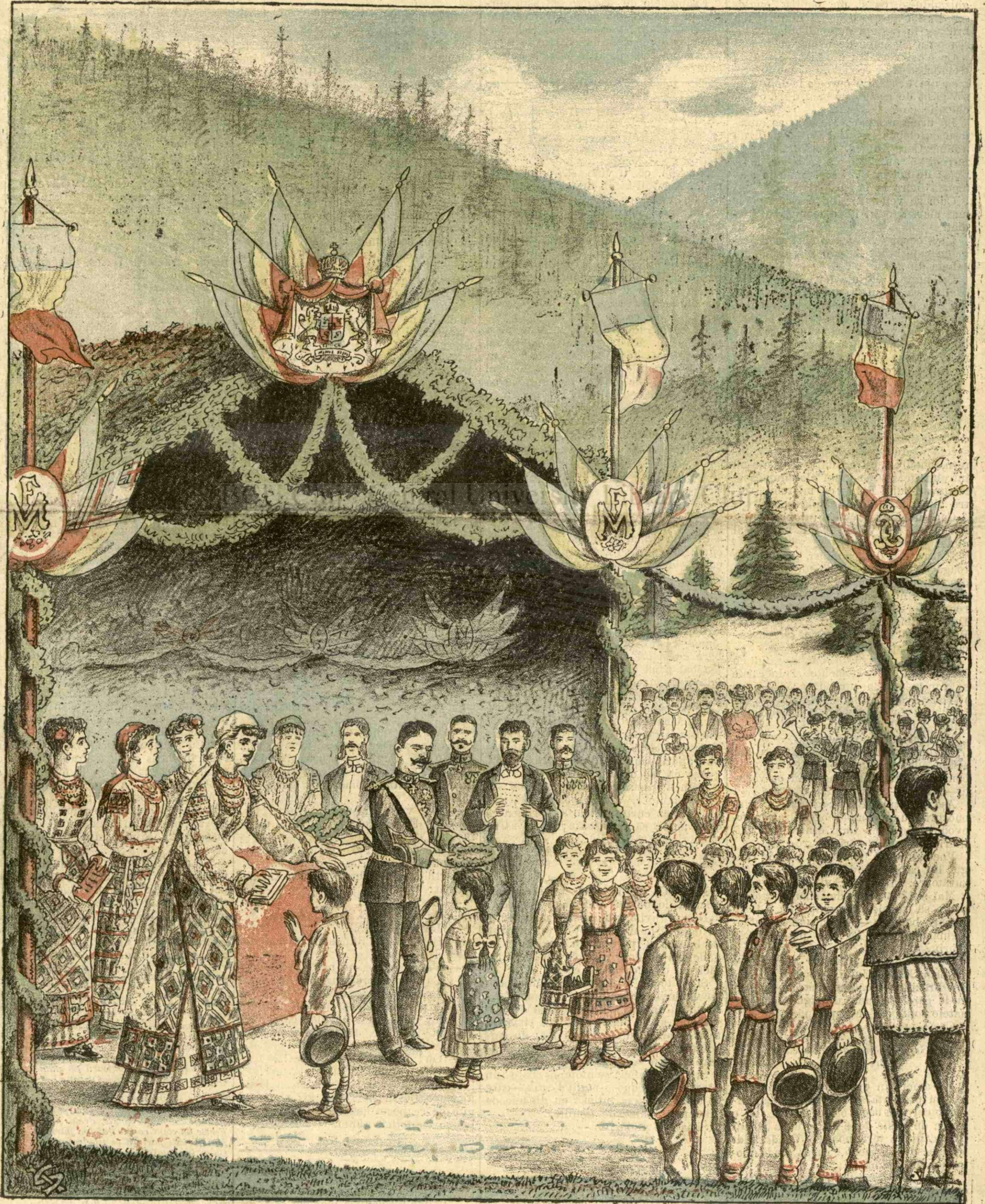
Distribuirea premiilor la elevii școlii din Sinaia de către principele Ferdinand și principesa Maria.—(Vezi explicația)