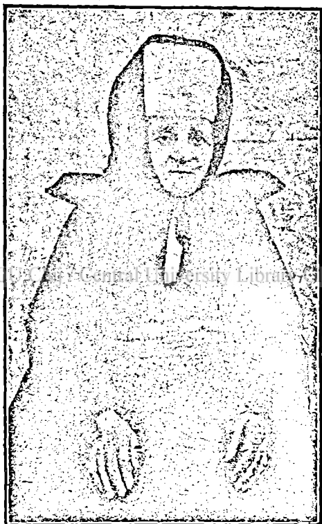
Bătrând din Pind în etate de 102 ani.

ca spirit de antrepriză comercială, ca muncă și ca inteligentă“. Iar marele învățat al Franței, fostul consul al lui Napoleon, anume Pouqueville, scrie, printre atâtea altele, și următoarele: