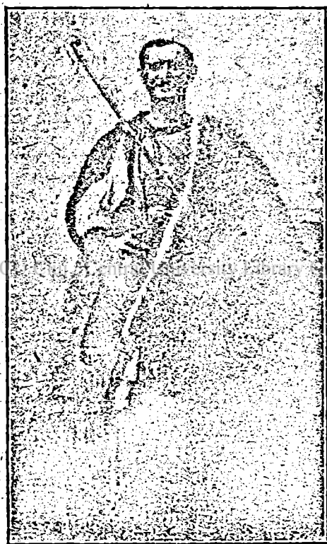
Păstor din munții Pindului.

în jurul anului 1821 precum și mai târziu. 4. Perivoie , supranumit și comuna bravilor, la poalele muntelui Oul . 5. Călaril'i , vestit în direcția industriei de o artă superioară, mai ales