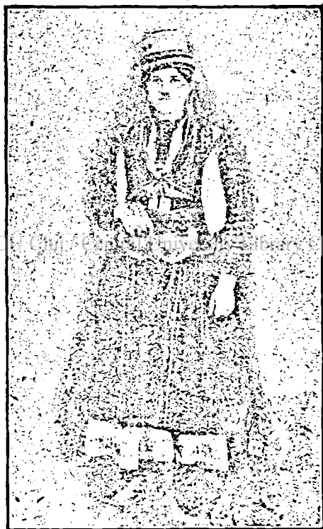
Aromâncă fârșeroată din Albania.

bisericeii dominante în peninsula, și anume sub egida crucei grecești, sub drapelele căreia se înrolează și Aromânii. În luptele încinse, dacă Grecii au susținut lupta prin patriotismul lor manifestat în direcție retorică, politică, eco-