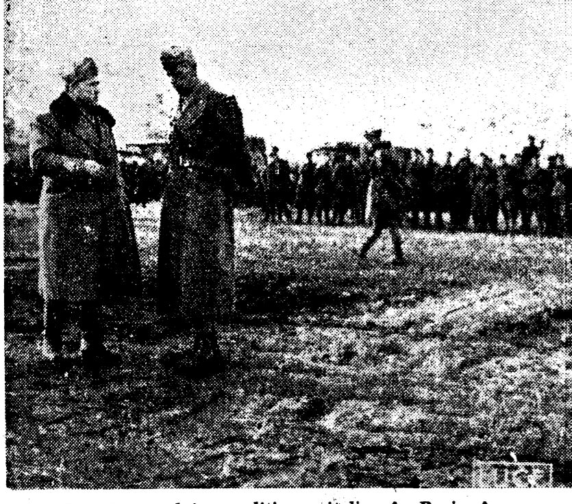
Comandantul corpului expediționar italian în Rusia, în convorbire cu comandantul diviziei Pașubia