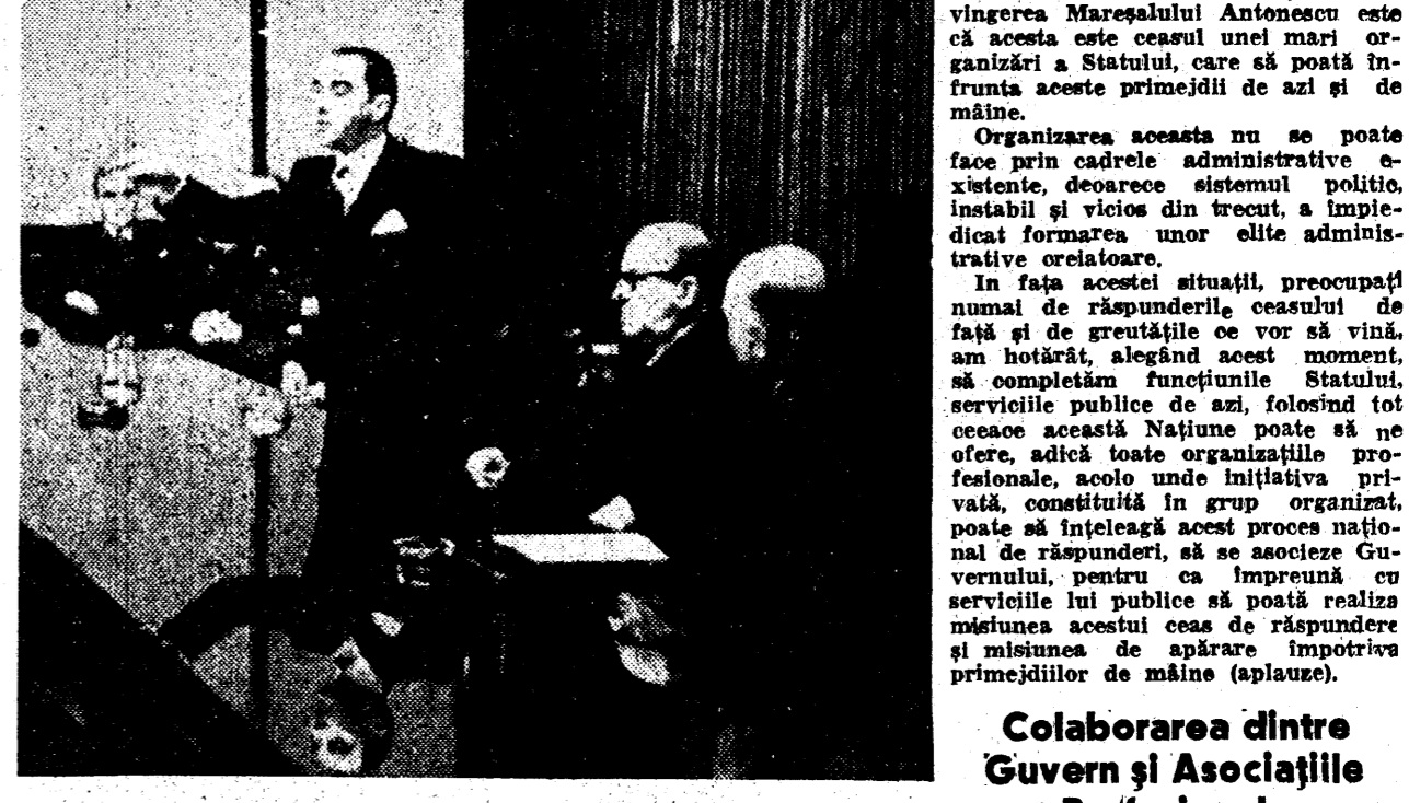
D. prof. Mihai Antonescu, vice-președintele consiliului de miniștri, vorbind reprezentanților industriei și comerțului românesc, la U. G. I. R.

Expunerea d-lui prof. Mihai A. Antonescu președinte ad-interim al Consiliului, făcută în fața reprezentanților industriei românești.