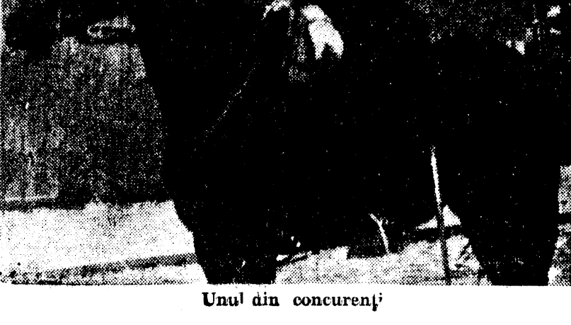
Unul din concurenții

Cu această ocazie, s'a dat și plecarea raidului cailor, București-Craiova, care va fi executat în minimum de timp posibil.