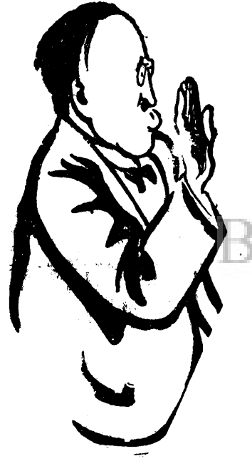
D. VIRGIL MADGEARU

forță economică și politică de primul rang, ca să copiem metodele hitleriste. Și dacă, admind prin absurd, că vom alunța 100 mii evrei, vom ține țara, în care rămân 3 milioane 600 mii minoritari de atâtea neamuri? Românii vor fi ajunși astfel, la România Romanilor?