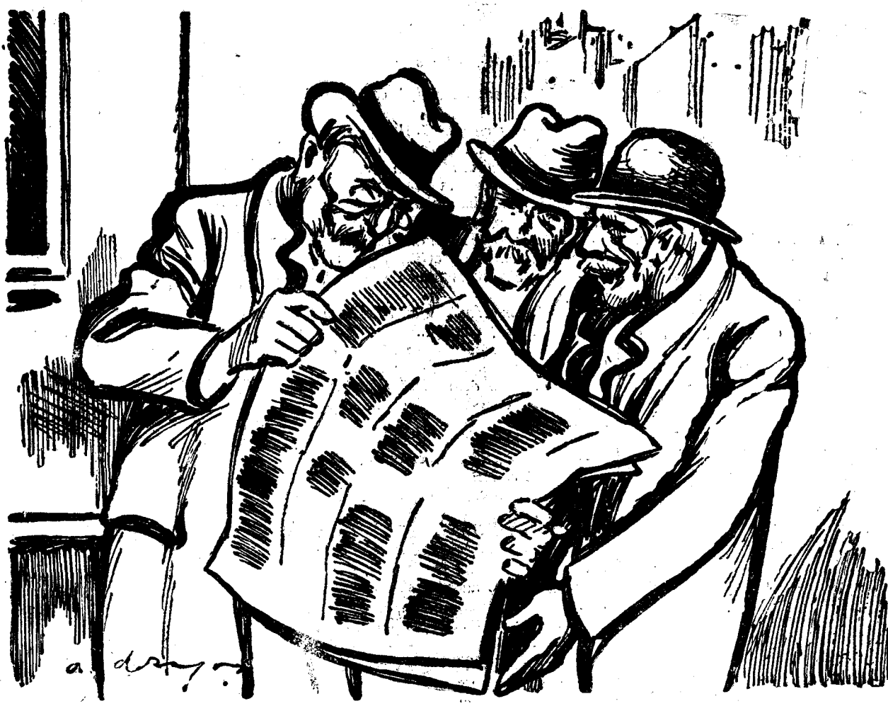
— Ei, a fost țigănie mare la congresul țigănesc? — Nu, dragă, nu era congres politic...