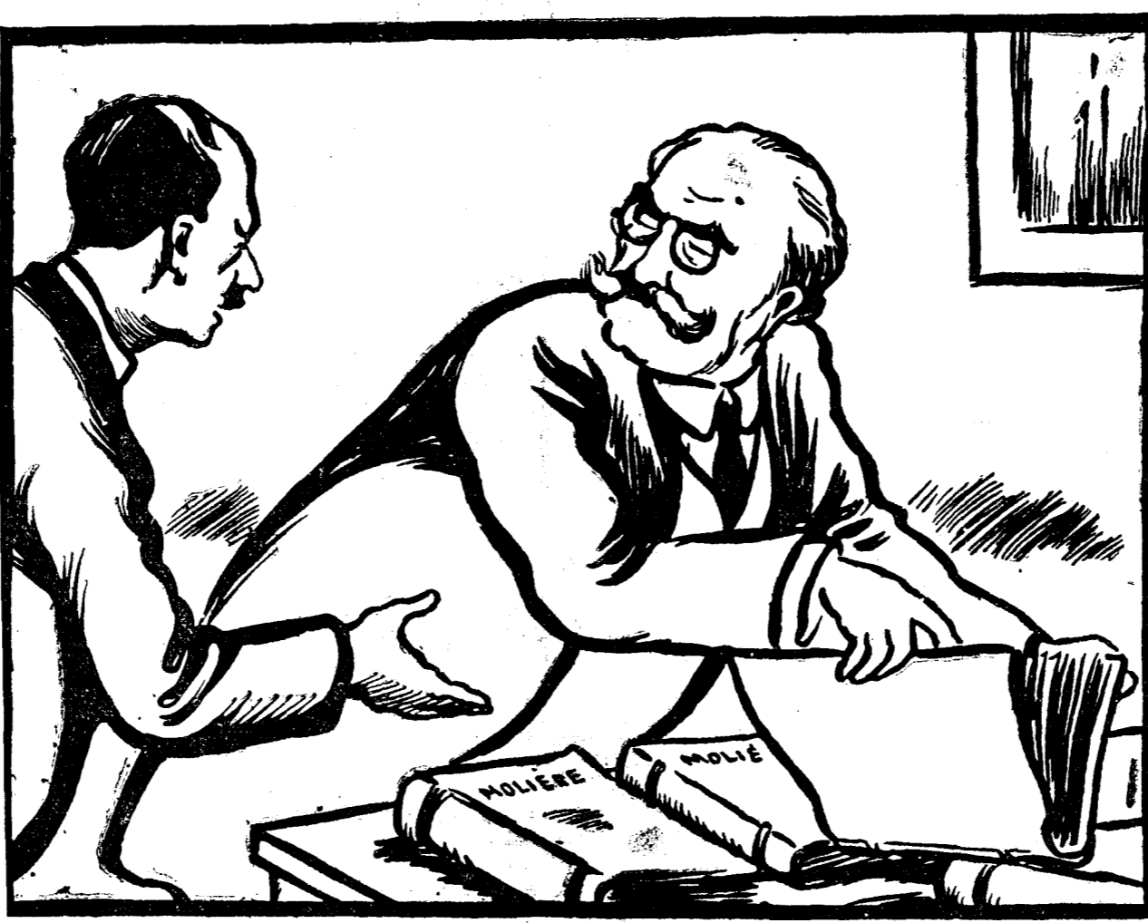
- Ce mai căutați în Molière, d-le Valda? - Tot o comparație pentru Maniu. Caut „Bol navul inchipuit”...

Am avut, la Camera, o zi consacrată în întregime unei grave execuție constituționale, cu participarea elocinței tuturor seifilor de partid, mari și mici.