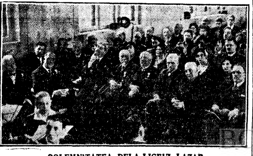
SOLEMNITATEA DELA LICELUL LAZAR

PRAGA, 20 (Rador). — Măscarea iredentisită a organizației „Hakenkreuzler” se întinde din ce în ce. Cu ocazia arestațiilor cari au fost făcute, partidele naționaliste germane au intervenit în favoarea celor arestați, la locurile competente.