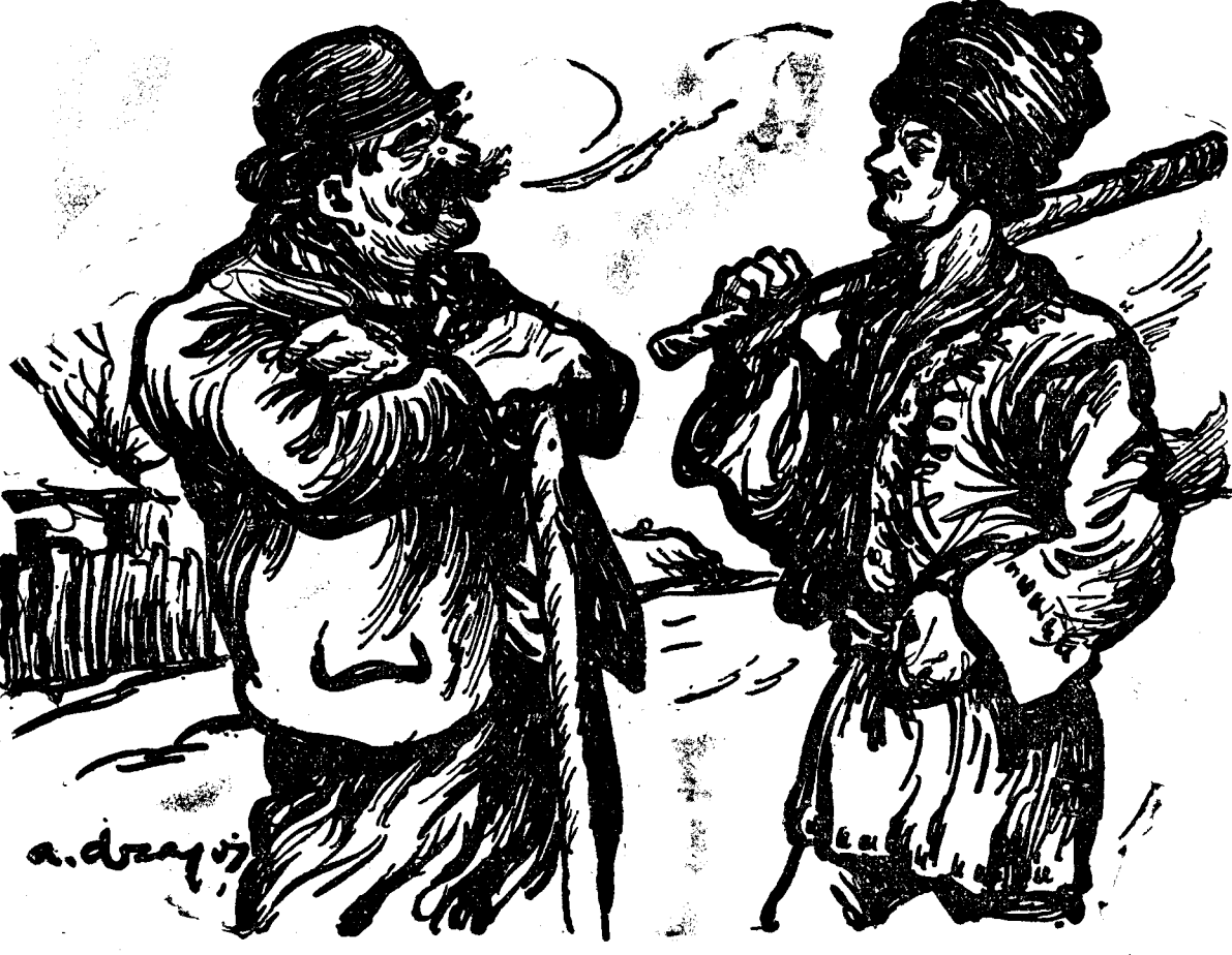
— Strașnică trebuie să fie, neică, legea asta electorală!... Nici nu s'a votat, și ia te uită ce fru mușete de bătaie s'a incins în jurul ei!...