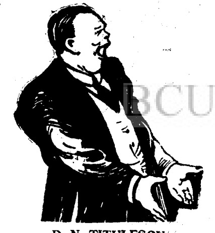
D. N. TITULESCU

D. Argetoianu se va afla în Occident într-un moment hotărâtor pentru situația internațională, adică atunci când se revizuiesc toate raporturile po-