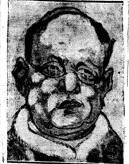
PAPA PIUS XI

Prin această enciclică Papa îndeamnă pe toți