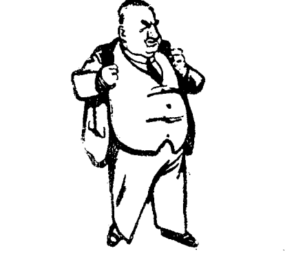
D. C. ARGETOIANU

Dela Roma d. Argetoianu va pleca direct la Londra, unde deosemeni va lua contact cu șeful guvernului și cu bărbății de seamă ai imperiului britanic.