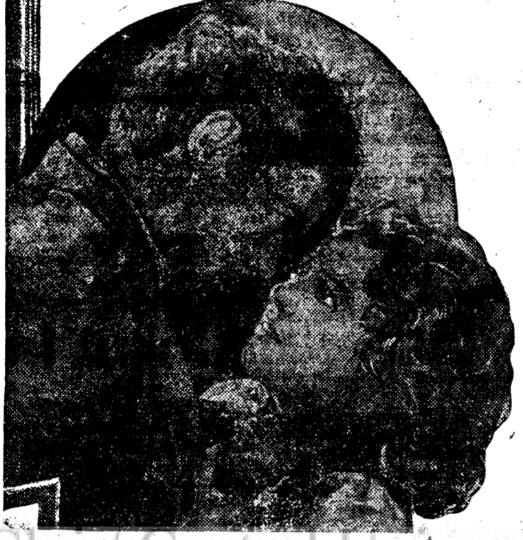
JANET GAYNOR ȘI CHARLES FARRELL

La Regal: „Drumul pierzării“ Cu începere de azi, pe ecranul cinematografului Regal, se va proiecta, una din realizările cinematografice, cari s'a bucurat de un succes triumfal în străinătate. Este vorba de o dramă reală, care e punctul de apogeu al unei întregi serii de producții în mers de ascensiune. Regia și-a găsit expresia ei cea mai perfectă în conducerea magistrală a celebrului regisor Raoul Walsh. Interpretarea s'a bucurat de celebrul artiști Janet Gaynor și Charles Farrell. Subiectul, Thomas Randolph, e furios de ultima escapadă a fiului. Când vine mătușa lui Stephen.