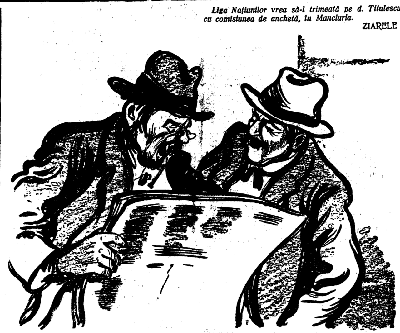
Tot noroace de astea are bietul Titulescu! Ba il trimite să impace pe chinezii, ba il cheamă să-i impace pe național-țărăniști...