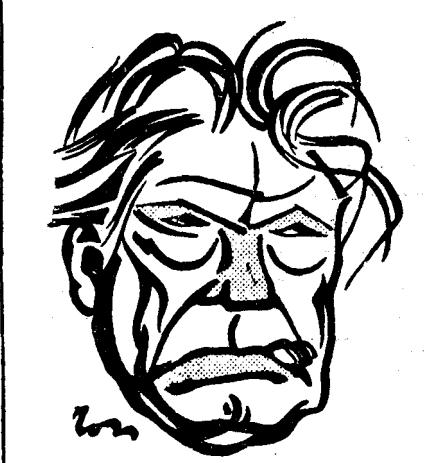
D. CONST. STERE