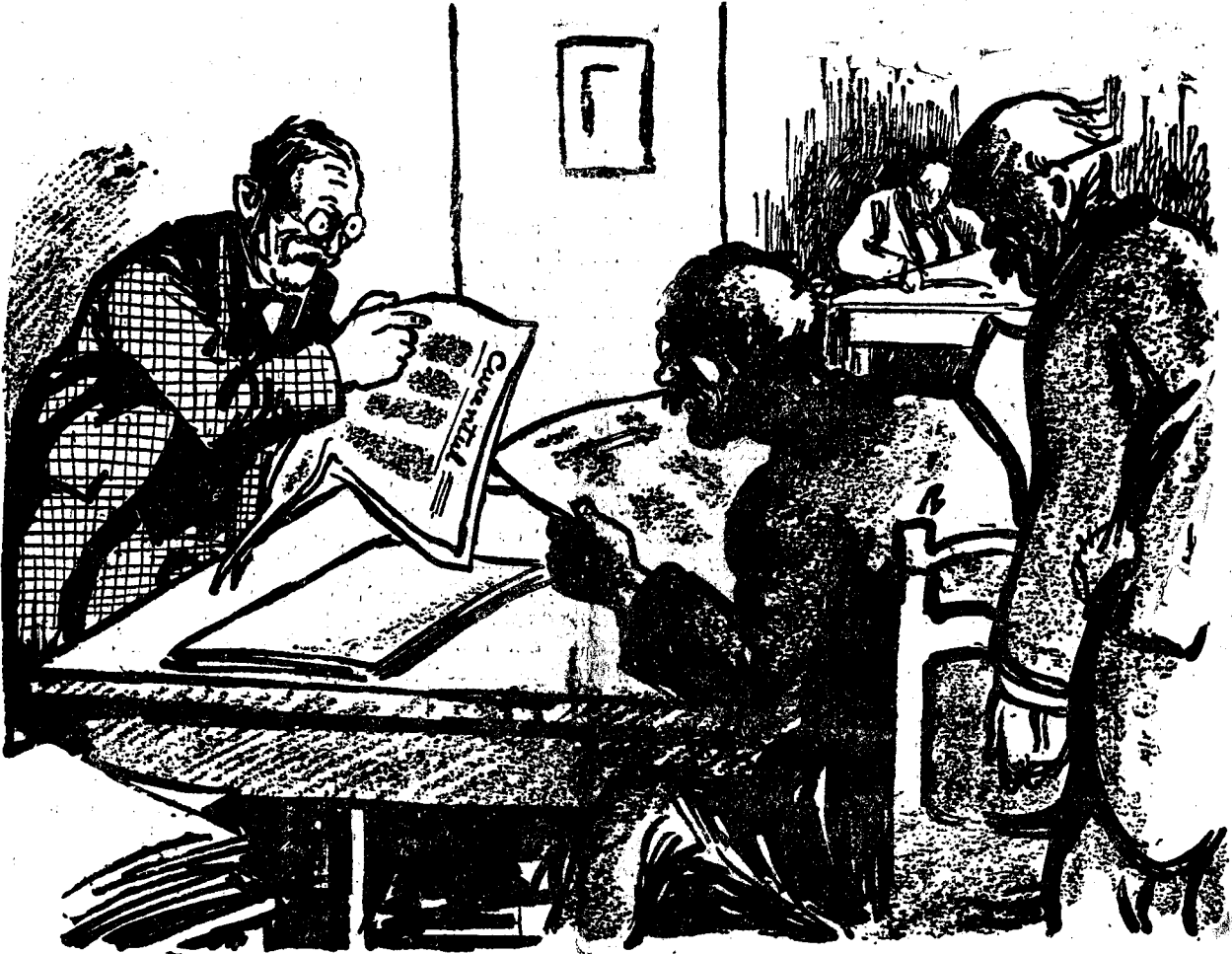
Bine de fericiții de Chinezi, că la ei nu mai există de ani întregi nici un guvern!...

Citiți în pag. 4-a Principele Nicolae revine asupra renunțării?