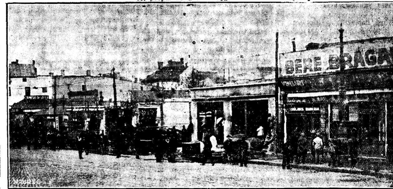
ASPECTUL LUCRARILOR DE DARAMARE