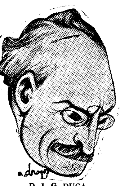
D. I. G. DUCA

a) de a risipi nedumeririle ce domnesc în cercurile politice și financiare streine în privința unor situații din România și b) de a cerceta dacă cercurile financiare din streinătate păstrează față de partidul liberal dispoziții favorabile din trecut în ce privește respectarea angajamentelor financiare ale țării.