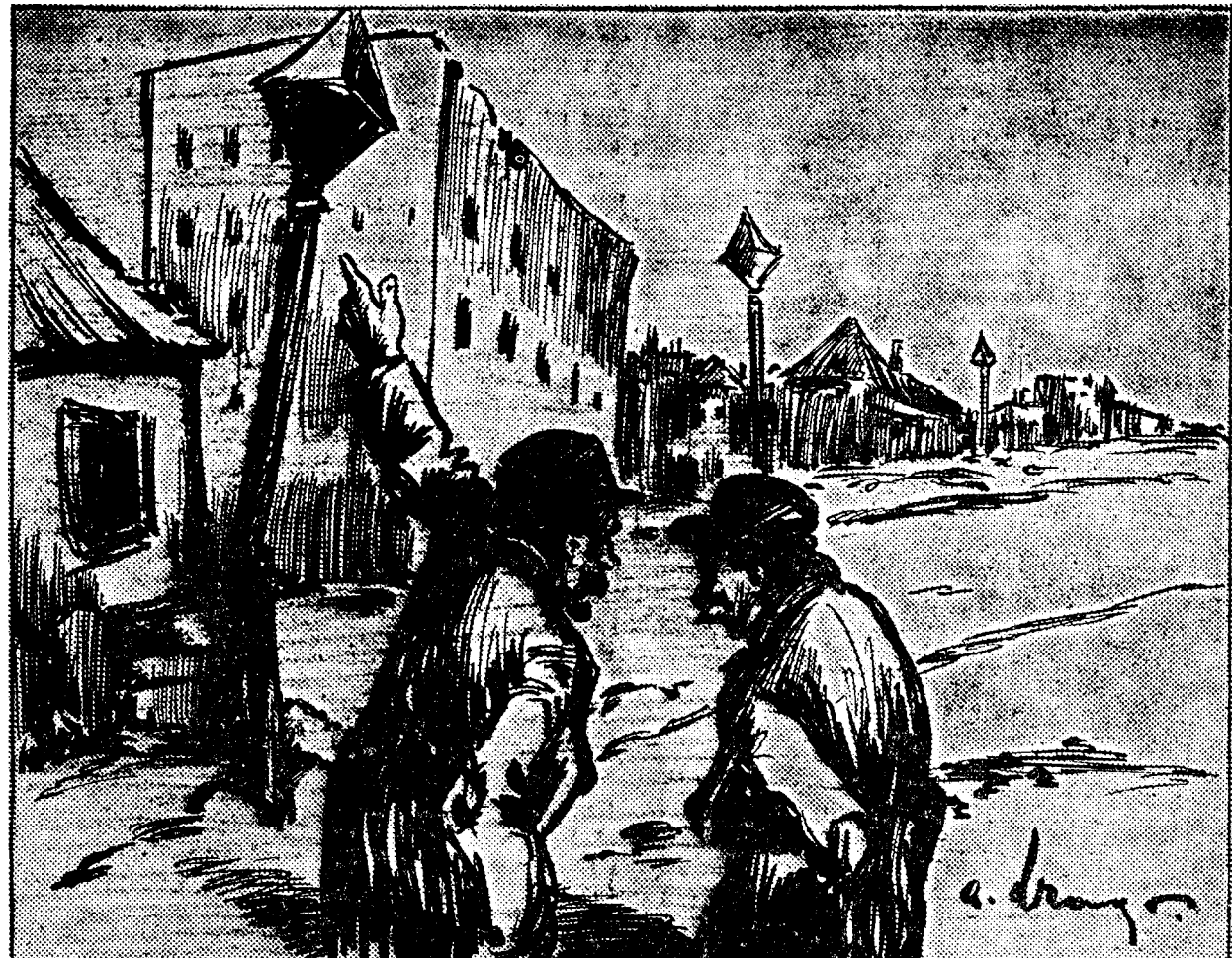
— I-auzi, bre, cică unii Marconi dela Roma aprinde lămpile, prin aier, tocmai în America de Sud... — Ce vorbești, domnule? Hai să-l rugăm să ne aprindă și nouă vreun felinar, pe aici prin mahala, că dela Primărie e slabă nădejde...