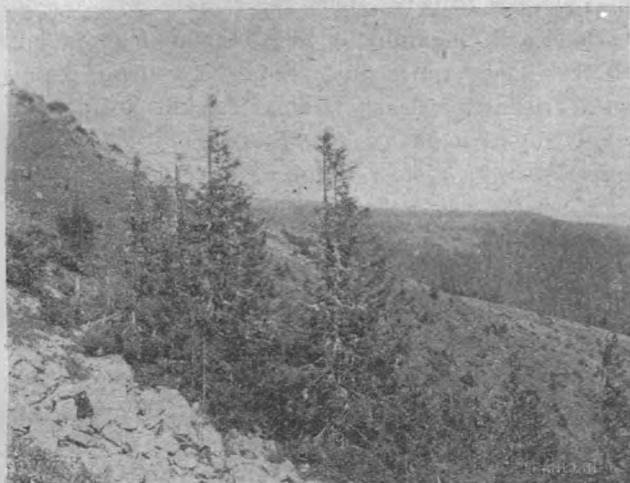
Az erdő felső határa a Keleti-Kárpátok «Kelemen havas»-án (1700 m.) — Róth Gy. fölvétele.

példát ad a már említett modori jegenyefenyves, mely Magyarország legalacsonyabb jegenyefenyőtermőhelyeinek egyike, a felső határra — a fatenyészet felső határára — pl. az utolsó lúczok a Keleti-Kárpátok Kelemen-csoportjában.