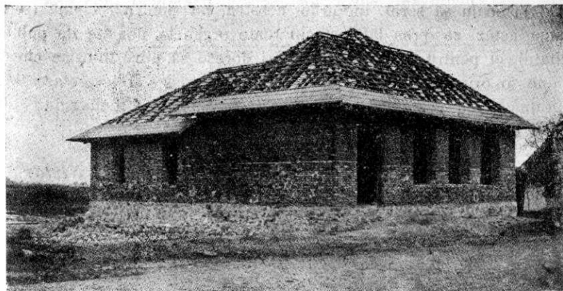
Noile construcții școlare din jud. Sălaj. Școala primară de stat din comuna Giorocuta.

Dela ei nu se puteau ridica sumele acestea. Comitetul central în fața acestei situații a cerut ajutorul tuturor comunelor din județ: fiecare cap de familie să plătească o taxă de 5 lei, pentru fiecare jugăr de pământ ce-l posedă, iar comercianții și industriașii o sumă echivalentă socotită după darea ce-o plătesc fiscului. S'a cerut, să înțelege, ca aceste sume modeste, ca să poarte pecetea legalității, să fie votate din partea conziliilor comunale, indiferent, dacă în comuna respectivă se zidește sau nu. Principiul e clar: dacă pentru interes obștesc din dările, cari se percep dela toți locuitorii țării, se fac căi ferate, poduri, linii telefonice etc. numai într'o anumită regiune, sau ținut, și în structura internă a unui județ se poate preconiza această măsură salutară, care asigură progresul, dând puțința satelor sărmâne să-și ridice scoli cu concursul și ajutorul celorlalte comune mai bine ineztrate și mai bine situate economiceste. Se desprinde de aicea și o datorie de onoare a intelectualilor noștrii — preoți, învățători, proprietari mijlocii, cari fac parte din conziliile comunale — de a nu face operă demagogică, stârnind un curent ostil acestei idei și de-a sprijini cu căldură această măsură, care este luată