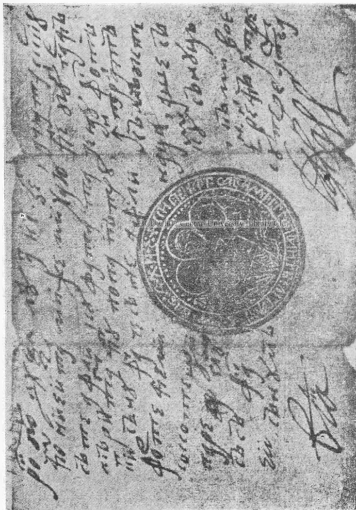
Răvașul Mitropolitului Sava Brancovici dela 18 Aprilie 1661.

Această nouă și ultimă confirmare a lui Sava reprezintă un moment însemnat din păstorirea lui. E încheierea cu succes a unei lungi și grele lupte, purtată cu tenacitate și cu multă iscusință politică de Mitropolitul Sava, pentru păstrarea unor drepturi câștigate prin proprie vrednicie.