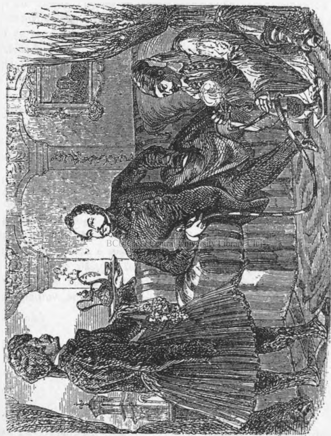
DIN TIMPURILE VECHI: MARIA SA CONSULUL STRĂIN (după același).

Supliment la «Săptămânitorul», anul V, No. 10.