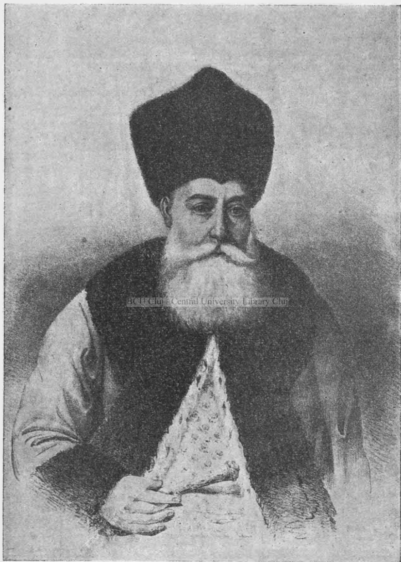
Dănu : GRIGORIE DIMITRIE GHICA, Domn al Munteniei (1822—1828).