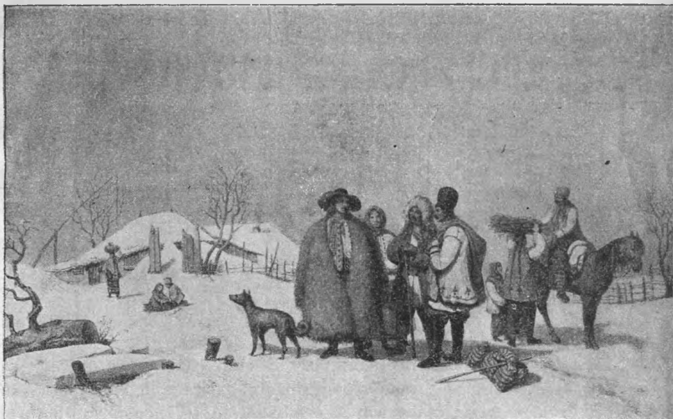
Privești de iarnă (după Bonquet).