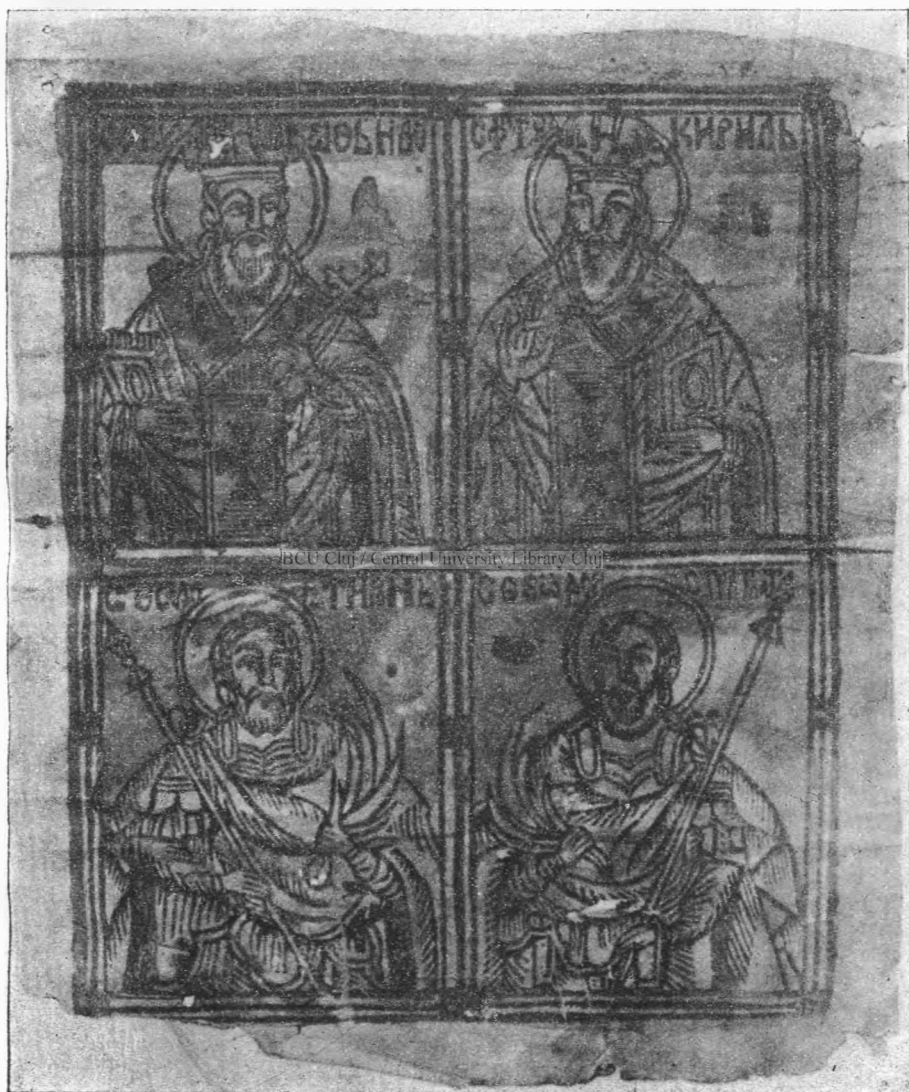
Una din cele mai vechi icoane tipărite pentru Romîni (pe la 1700).