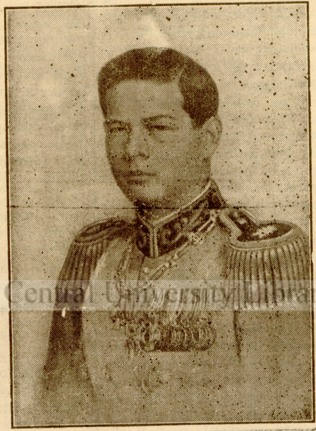
M. Sa Regele MIHAI I

se bucure de libertatea mărilor și să aibe drepturi egale pentru navigația liberă pe fluviile cari străbat mai multe țări.