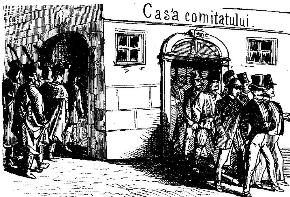
O scena dupa organisarea comitatelor conformu noului proiectu de lege.

Proprietariu, redactoru respundiatoriu si editoru: Iosifu Vulcanu.