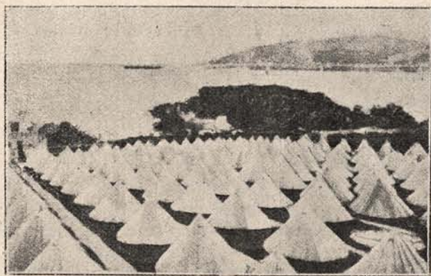
Lagărul de concentrațiune al prizonierilor germani, internați în insula Man, în nordul Angliei.

Ceea ce este curios, e că acest animal vine uneori în număr mare, de mii și zeci de mii și nu se știe nici de unde vin, nici unde dispar.