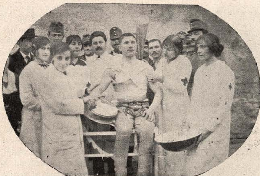
Spitalul „Sf. George“ din Blaj. Domnișoarele din societatea aleasă a Blajului, îngrijesc un soldat rănit.

Strasburg, Metz, Rickendorf (Colonia); iar spre Rusia la Königsberg și Thorn. Al șaselea se găsea la Liegnitz, în apropiere de granița austriacă. Alte 3 hangare militare se găseau la Tegel (Berlin). Apoi se mai găseau 4 hangare transportabile, cu o lărgime de 80 metri și erau astfel construite că pot fi montate de 150 oameni în 24 ore.