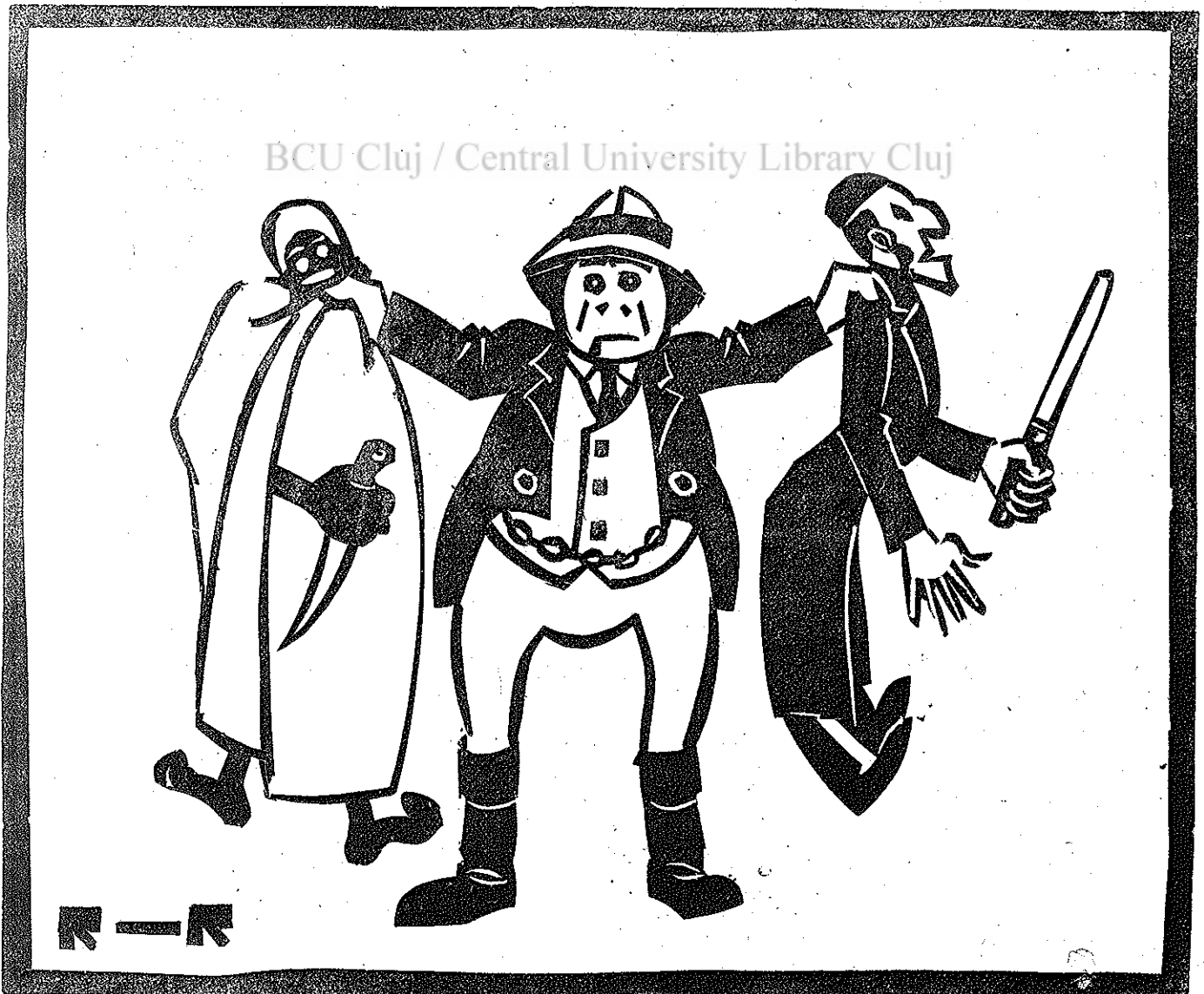
Reschner linorajza és metszete