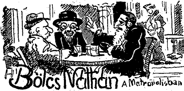
Bölcs Valtán A Metropolisban