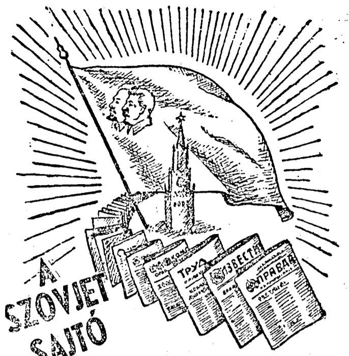
tükrözi a kommunizmus építését a Szovjetunióban.

Ezzel siet vissza a mozdonyra, mert a Sztálin elvtárs 71. születésnapjára vállalt kötelezettségét teljesíteni akarja. A mozdonynak ma este ki kell indulnia... (—)