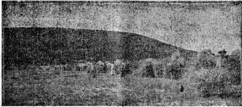
Lucrul câmpului pe terenul institutului din Boroș-Ineu, jud. Arad.

Clasificația dela sfârșitul anului școlar a avut următorul rezultat: