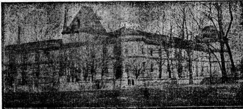
Institutul medico-pedagogic din Boroș-Ineu, jud Arad

Ramul de creștere al elevilor s'a divizat în 7 grupe, cel de ocupare în două grupe, a-