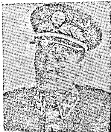
Tito marsall válaszában kiemelte, hogy a jugoszláv és román nép baráti együttműködése az imperializmusellenes arcvonal és a béke megerősödését jelenti.

Annak ellenére, hogy a négy külügyminiszter londoni tanácskozása eredménytelenül ért véget, a kapcsolatot nem szakadt meg teljesen a külügyminiszterek között, azaz a külügyminiszterek értekezletének intézménye nem tekinthető feloszlatottnak. Ugyanis a négy külügyminiszter a külgügyminiszter helyettesek elváltta az osztrák állam-szerződés tanulmányozását. A helyettesek szerdán már öszezövezték is tartották. Mindenek előtt a Szovjetunióhoz az ausztriai német vagyoni tárgyában tett engedélyeket tárgyalják. Az engedélyeket Molotov szovjet külügyminiszter közvetlenül az értekez-