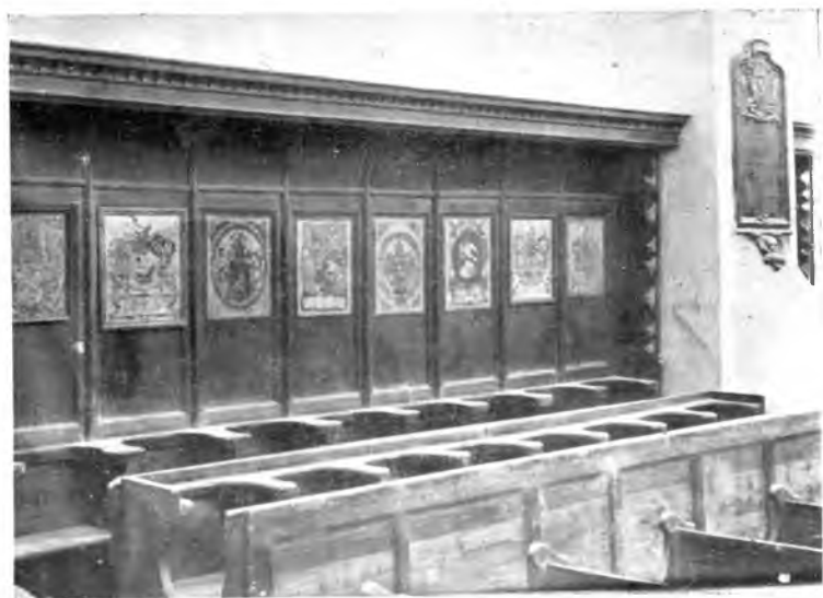
A farkas-utczai ref. templom czímensoros padja.