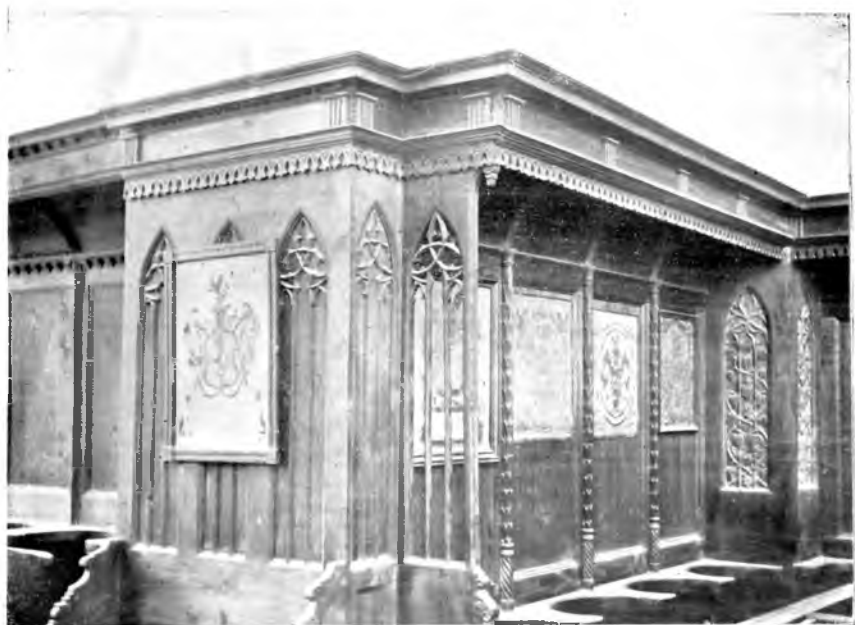
A farkas-utczai ref. templom czímensoros padja.