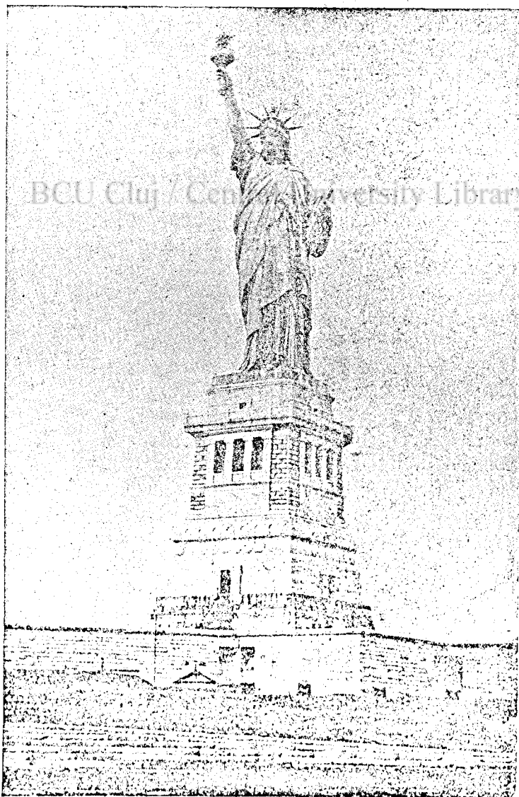
Az amerikai szabadság-szobor.

amely az azt jelenti: testvéri szeretet . A vad természet ezernyi székelyével, az indiánokkal és a