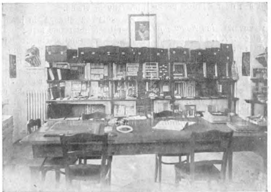
O secție a expoziției articolelor de librărie care se pot procura prin Federația Națională de Librărie, Editură și Arte grafice.