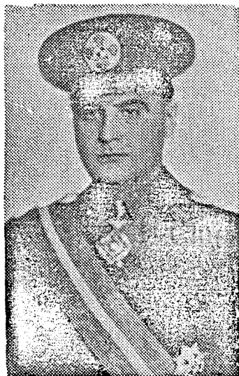
MIHAIL GHELMEGEANU Ministru de Interne