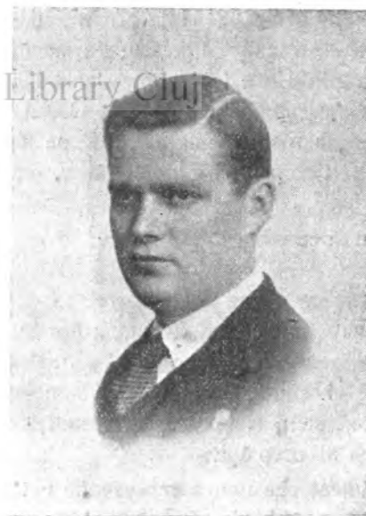
MIHAIL I. BURCULEȚ

„Scopul servitorilor Statului, între care Mă socotesc ca primul, este de a veghea, fără încetare, la ocârmuirea bunului mers al gospodăriei publice, pentru întărirea comunității și mulțumirea fiecăruia”.