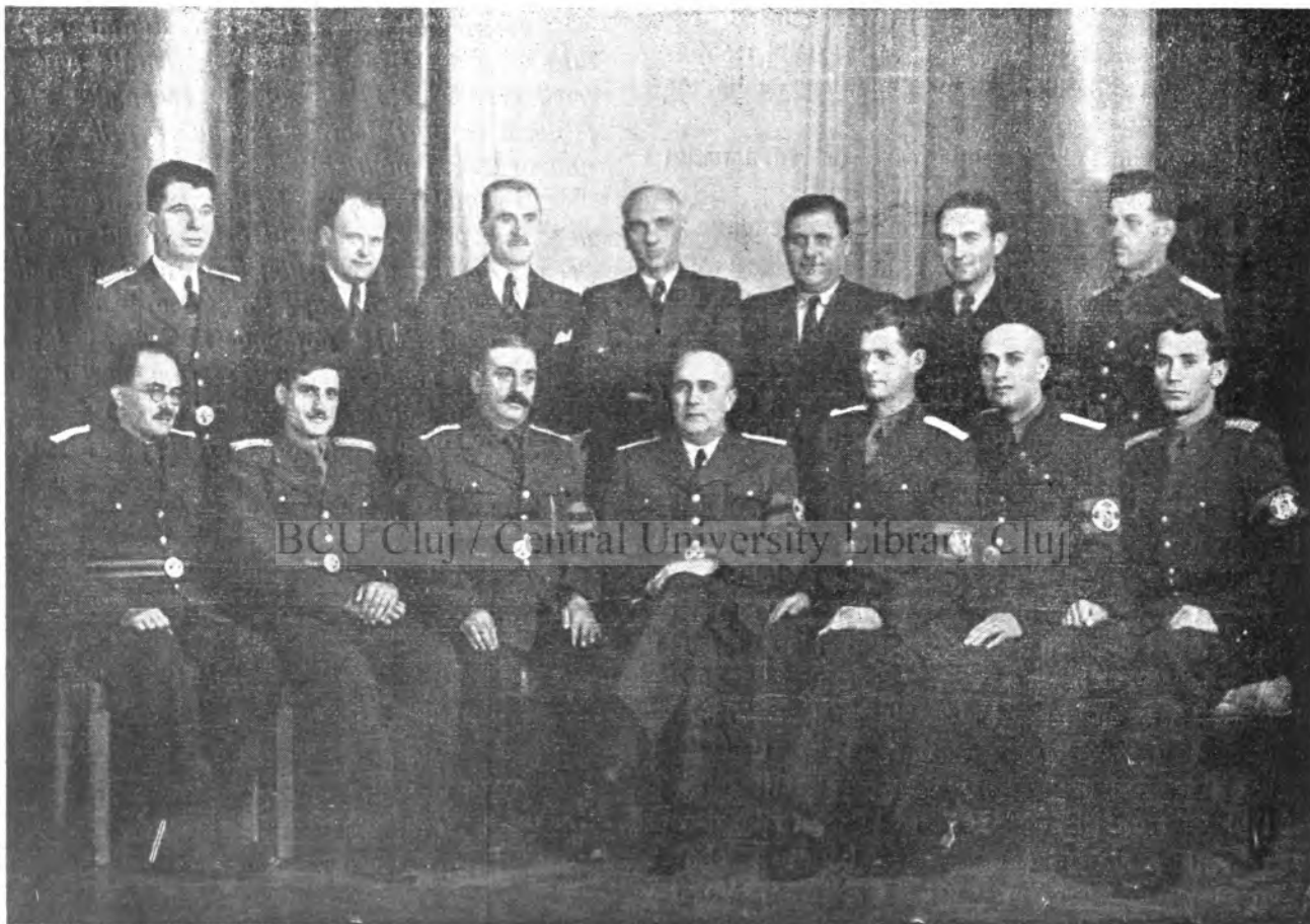
Comitetul de conducere al A. G. N. C. R. membri ai F. R. N.

S'ar putea înființa magazine de aprovizionarea cu alimente, în brănci și încălțăminte, precum și depozite de lemne pentru funcționari, cu plata în rate, care s'ar reține automat din salariile lunare.