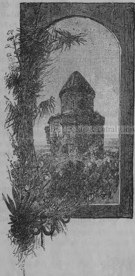
Ábuchámredán család egyháza.

hol erősebb zajjal beleütközve a magasból legördülő kövekbe; úgy tetszik nektek, hogy a völgy is panaszol. Ott látjátok a leszakadt öreg hidat is, mely Áchureán barátjának sóhajtásait hallgatja. Tanúja a Béchéntz-kolostor,