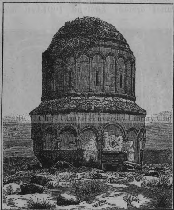
Az „Üdvözítő“ egyháza.

oldalon romok maradványai, majd egy kápolna, most szénapajtává átalakítva. Végre megérkeztek a falakhoz lihegve és fáradva. Beléptek a külső kapún keresztül; megcsókoljátok szenvedélyesen és forró ajkakkal azokat a tornyokat, melyek már ki vannak hülve és égve a naptól és a főkaput, melynek kövei érzéketlenek minden széllel szemben.