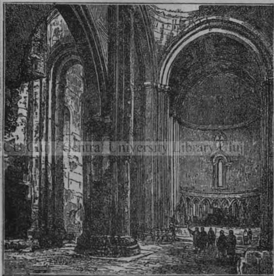
A „Székes-egyház“ belseje.

Vetek szemben egy emelkedett, terjedelmes, nagyszerű és magas építmény terül el, melyen baglyok tanúznak. Messziről halljátok ezek nyögéseit és borzasztó siralmas kiáltásait, ahelyett, hogy hallgatnátok az „allelujákat“ és az Istenhez intézett kedves templomi énekeket. A kúptető eltűnt és olyanforma érzést támaszt bennetek, mint egy szép leány lefejezése. Ez a főtemplom, melyet Szempád örmény király 950-ben kezdett építtetni. Az építést Kátránid örmény királyné 1001-ben fejeztette be