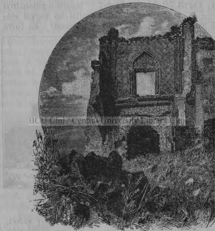
Bemenet az erődbe.

Mindent elkövettek, hogy oly gyorsan érkezettek el ide, a mint csak lehetséges; lovaitokat kergetitek, megereesztve a gyeplőt s egyúttal oldalütésekkel is sarkantyúzva; vagy megparancsoljátok a kocsisnak, hogy gyorsan haladjon, s ha parancsodnak nincs foganatja szép ígéretekkel szelidítetitek meg őt. Annyira kíváncsiak vagytok látni e helyet mielőbb, hogy lovaitoknak sebes menése