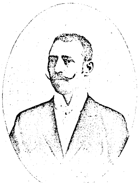
BCU Cluj / Central University Library Cluj Merza Gyula.