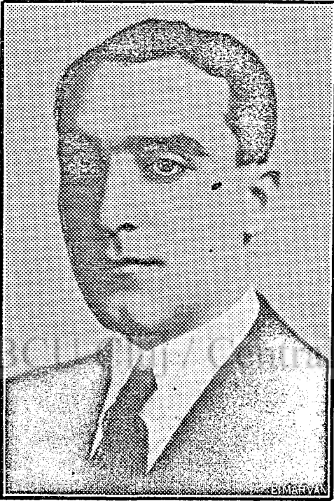
D-l deputat Mihail Roșianu

Îndrumarea agriculturii noastre dela deal și dela munți în direcția dezvoltării acestei ramuri de activitate, este singurul mijloc de a valorifica și munca și pământul locuitorilor din aceste regiuni.