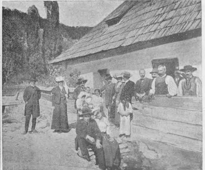
Două tablouri din Năsăud.