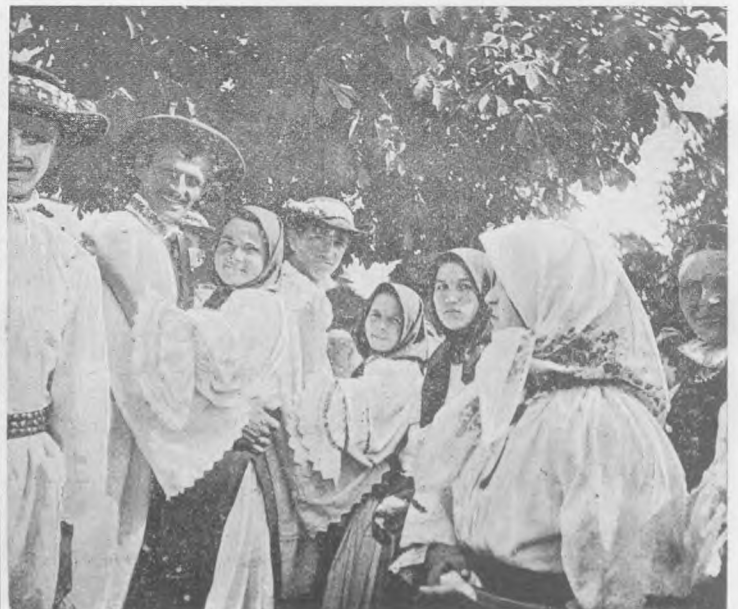
Alte două tablouri dela Năsăud.