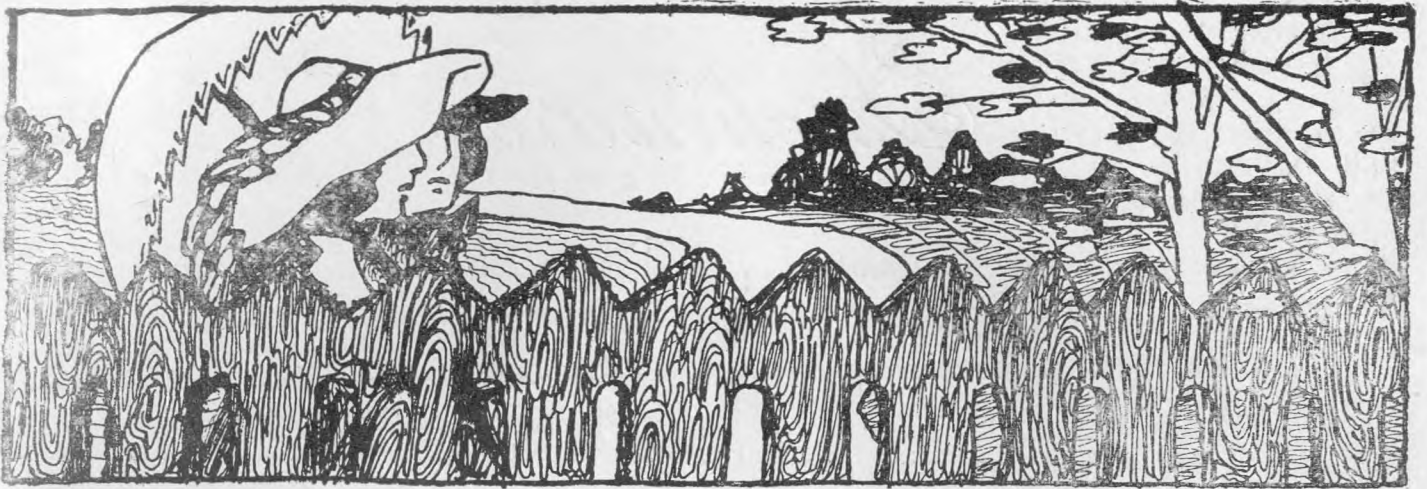
O păreche tineră la plimbare pe lângă uluci, de A. Duma.