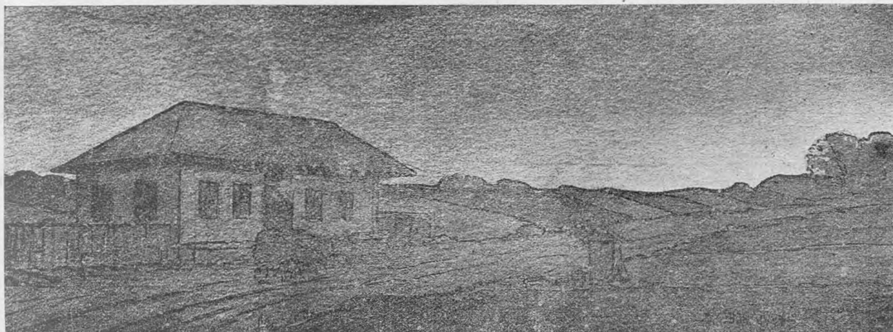
Un han pe vîrf de deal, de Petre Bulgăraș.