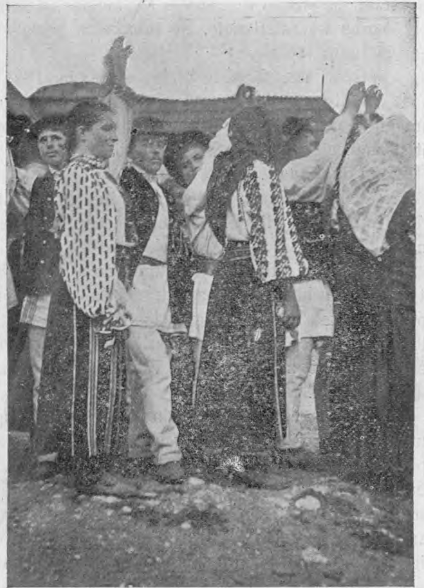
„De-a mâna“. Joc românesc din ținutul Branului. (com. Moeciul-superior).