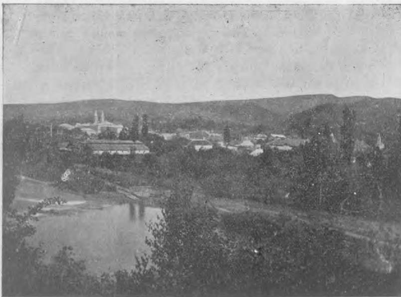
Vedere generală a orașelului Năsăud.

BCU Cluj / Central University Library Cluj Tom Pleșu