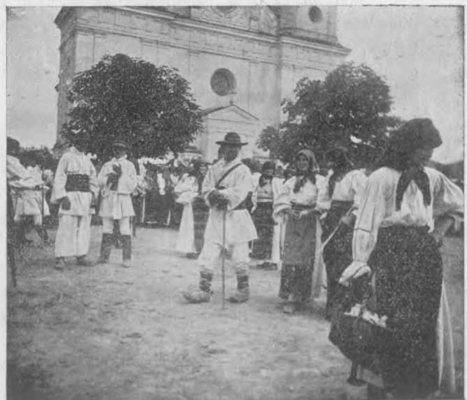
Porturi din Năsăud. In dos frontispiciul bisericii românești.