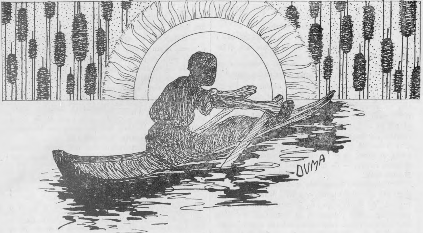
„PE VALURI“, de Alex. Duma.