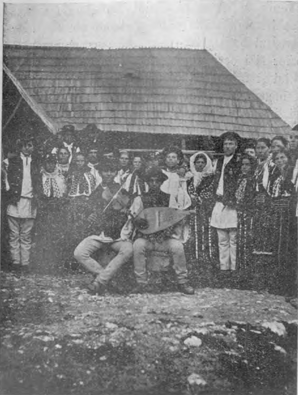
„Brîul“, Joc românesc din ținutul Branului. (com. Moeciul-superior).