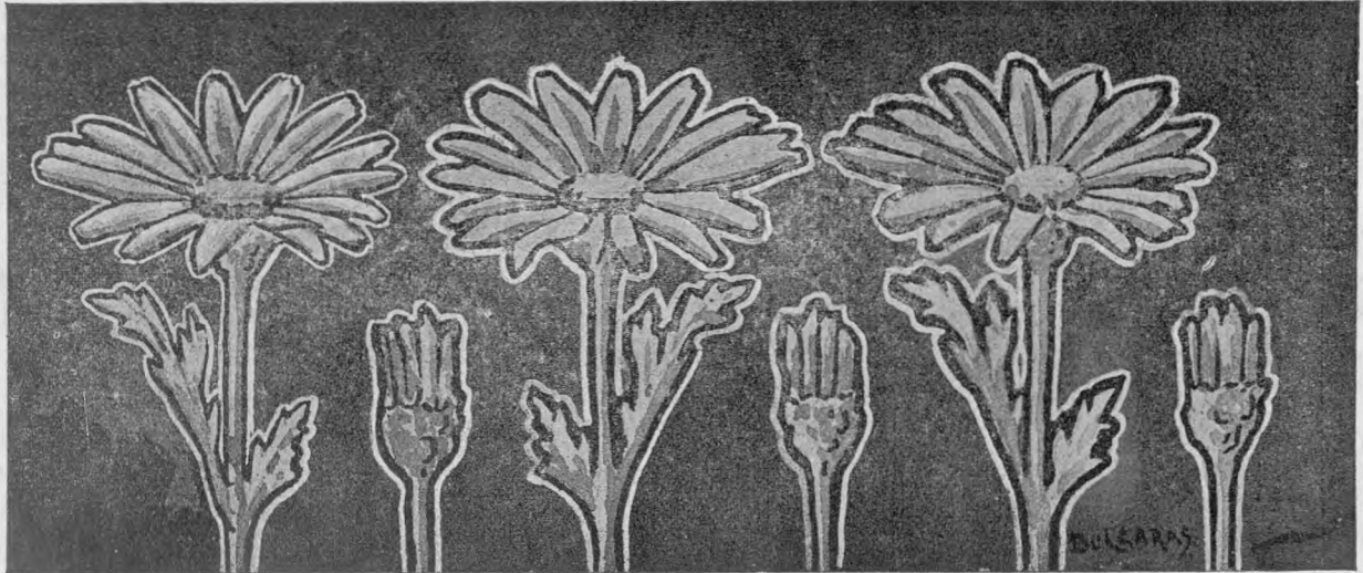
„MĂRGĂRITE“, de Petre Bulgăraș.