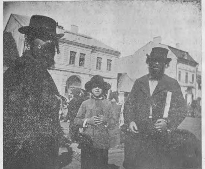
Piața Năsăudului, văzută mai de-aproape.