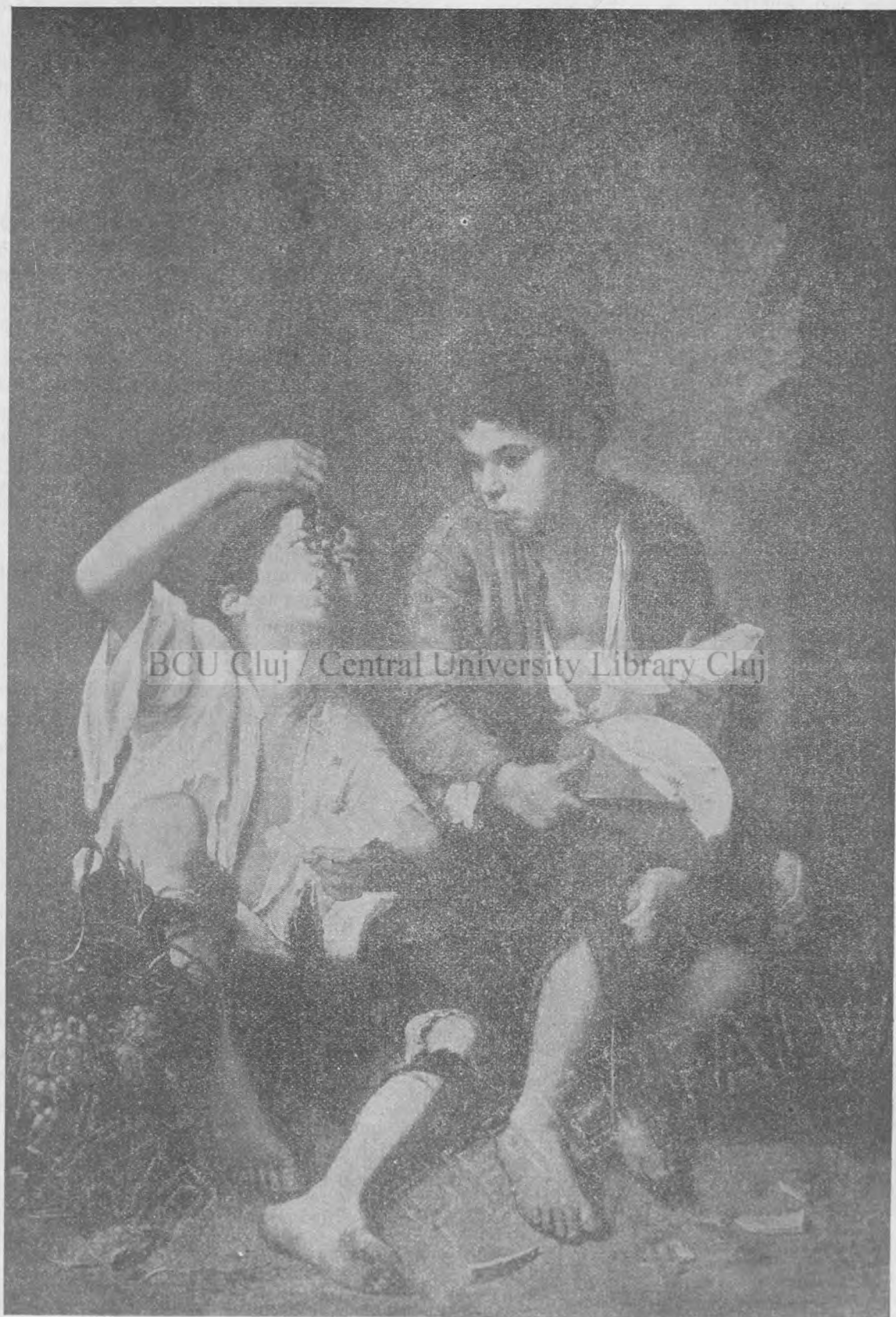
Copii, mincînd pepeni și struguri de Murillo.