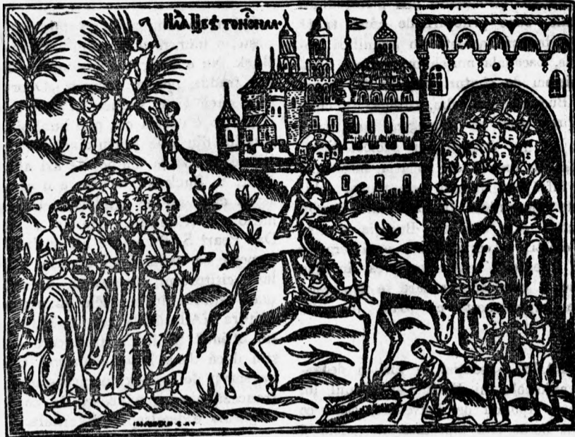
Iisus primit de popor cu stâlperi de finic