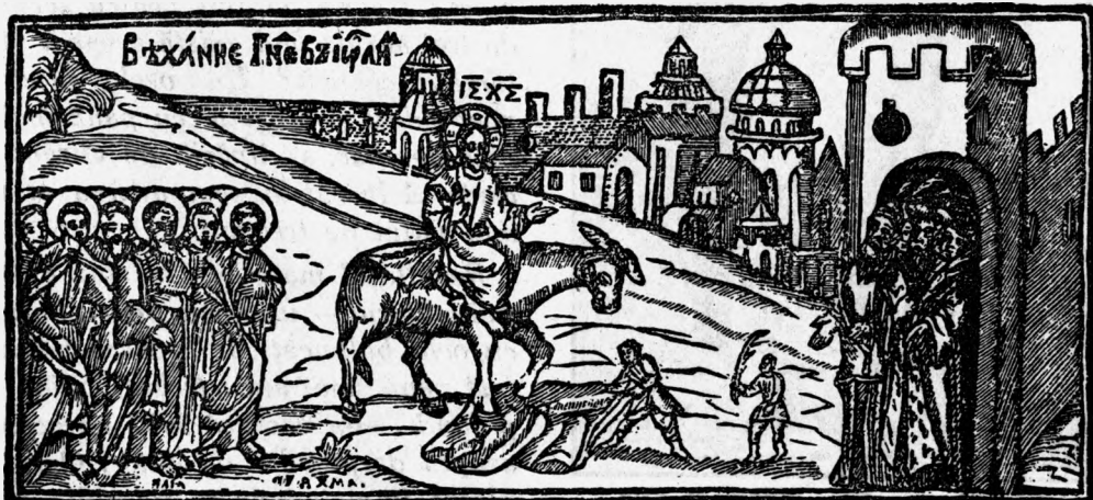
Intrarea lui Iisus în Ierusalim.

Floriile, prin intrarea în Cetate, ajunge astfel semnul și înțelesul adevăratei stăpâniri. Unsul Domnului este mai întâi domnul credincioșilor, al copiilor și săracilor; iar temeiul stăpânirii lui este recunoașterea înflăcărată a celor mulți, că este «trimisul»,