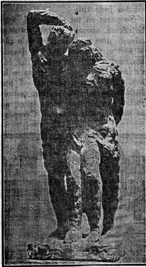
I. Jiga Adam și Eva

Ultimul gen literar, reportajul, căruia am căutat să-i explicăm apariția și să-i justificăm necesitatea, mai pune și alte probleme, mai vaste, poate de o importanță mai mare, și a căror prezentare ar fi edificatoare pentru cunoașterea epocii în care trăim.