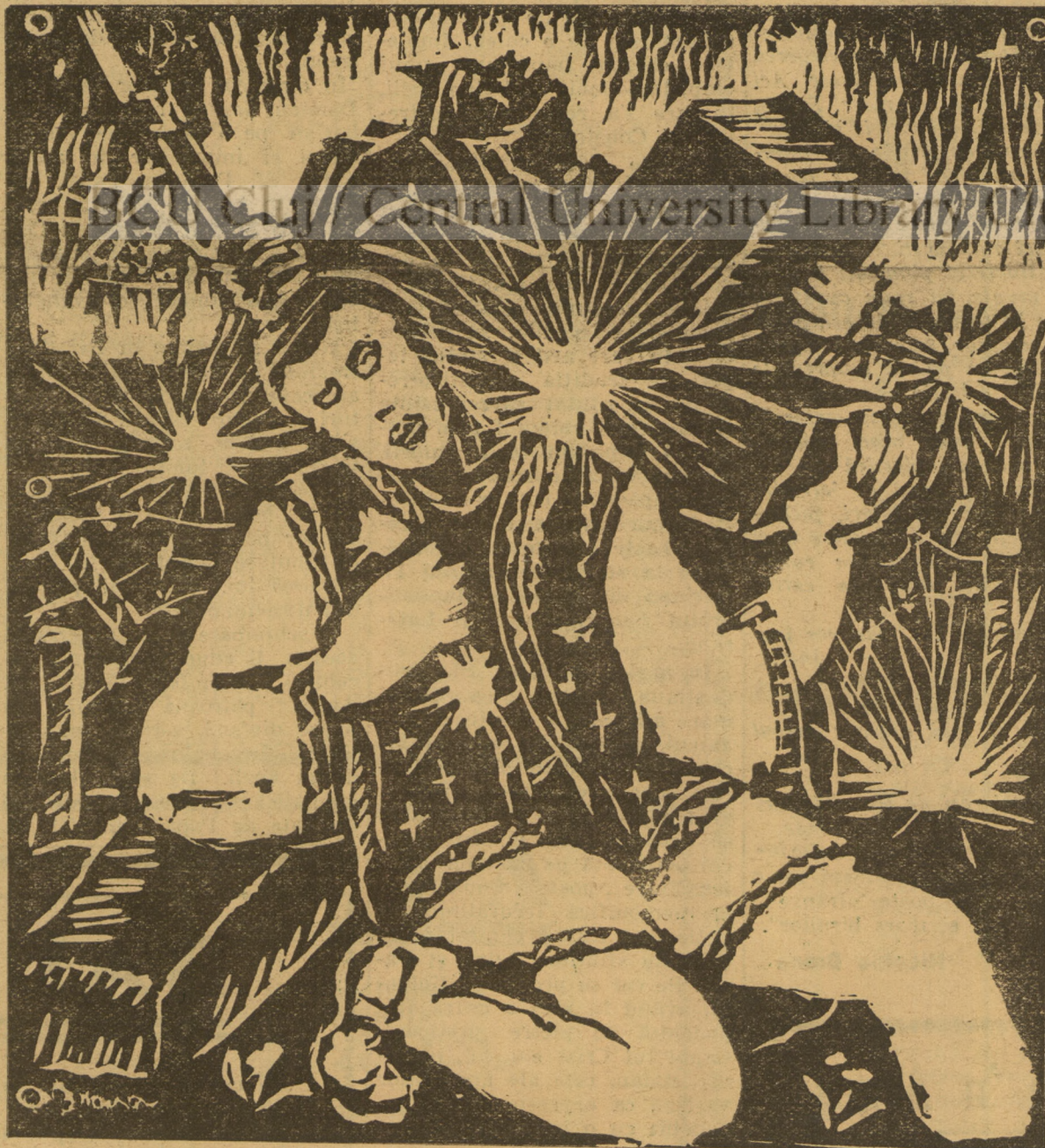
N. Bruna 1937

Căci numai Lor le datorăm salvarea sufletului nostru.