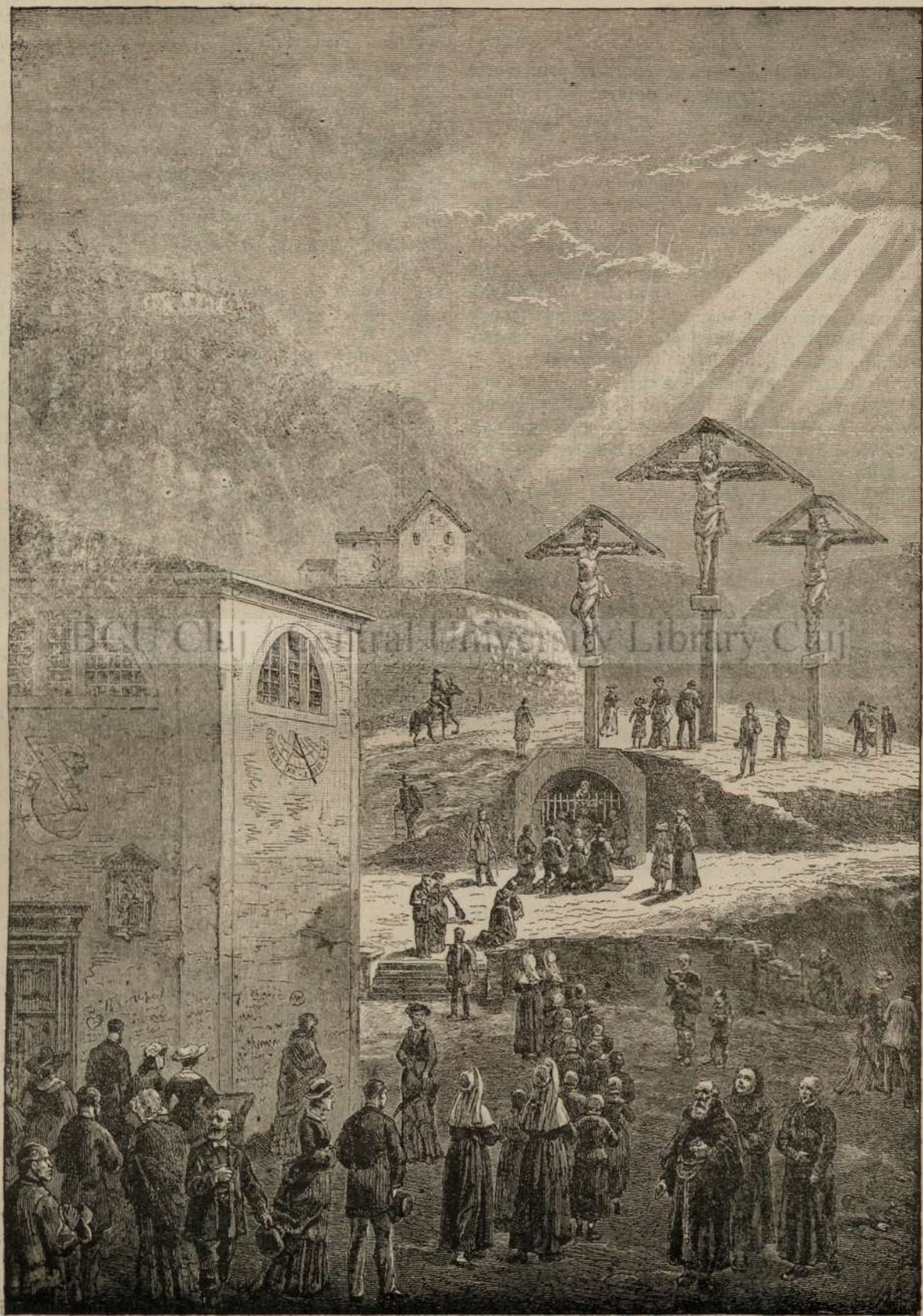
Peregrinagiu la Golgota.