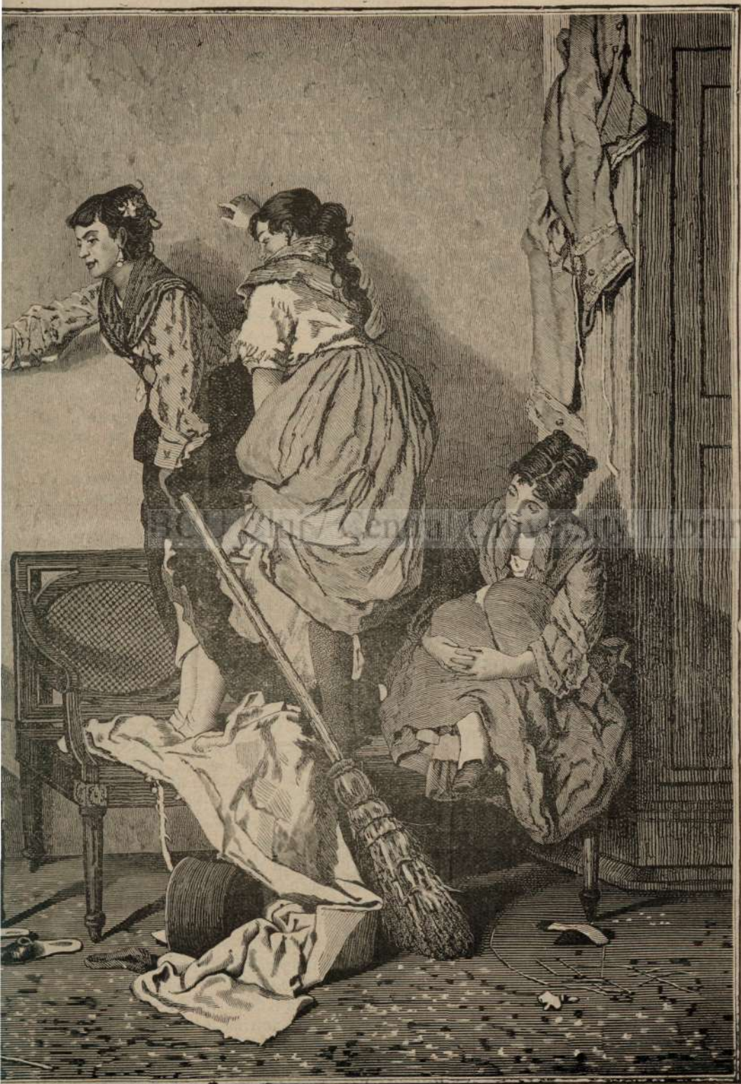
ujmani ai casei.