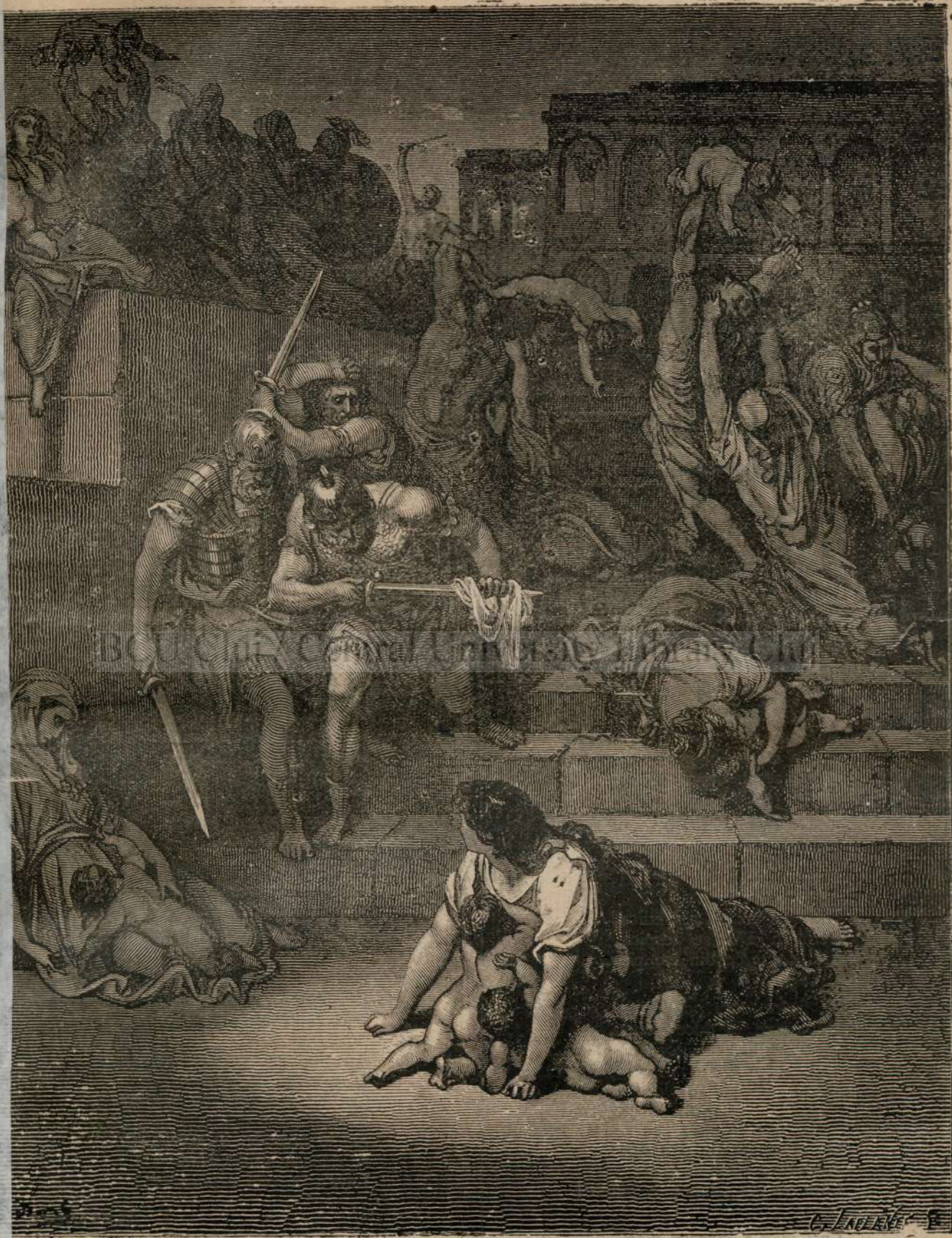
UCIDEREA PRUNCILORU — LA PORUNC'A LUI IRODU.