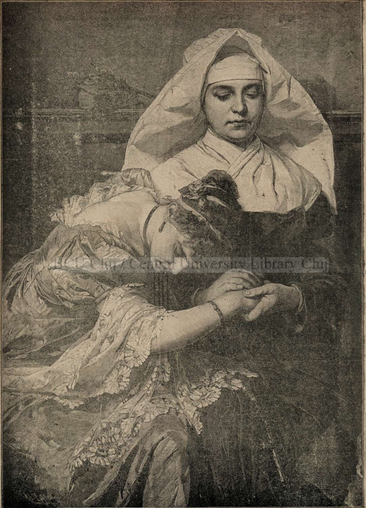
CARE E MAI NEFERICITA?