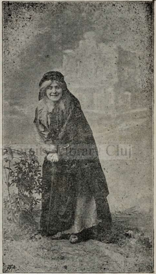
Têner'a farmecatória si betrân'a vragitória.